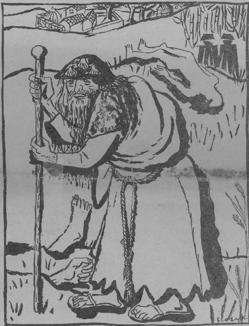
Dibuxo de SEOANE

Coa cachola baixa, triste e pensativo, un vello, moi vello, vai pol-o camiño.