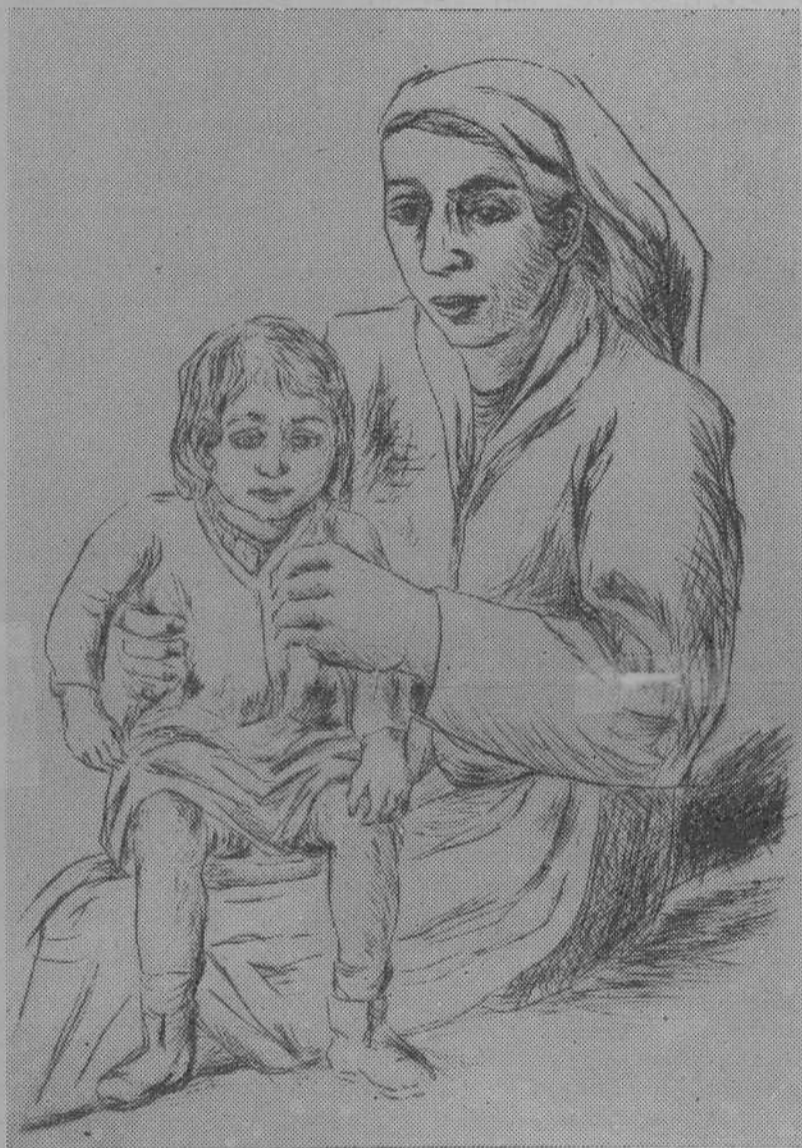
NAI E FILLA