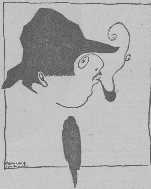
JOHAN V, VIQUEIRA. - DIBUXO DE CEBREIRO