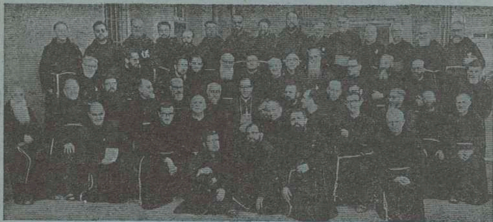
Su Eminencia Rvdma. el Cardenal Juan Landázuri Ricketts, O. F. M. Arzobispo de Lima y Primado del Perú, Legado Pontificio en el VI Congreso Nacional Eucarístico de León, acompañado de la Comunidad de PP. Capuchinos de aquella Ciudad y otros PP. Franciscanos asistentes al Congreso