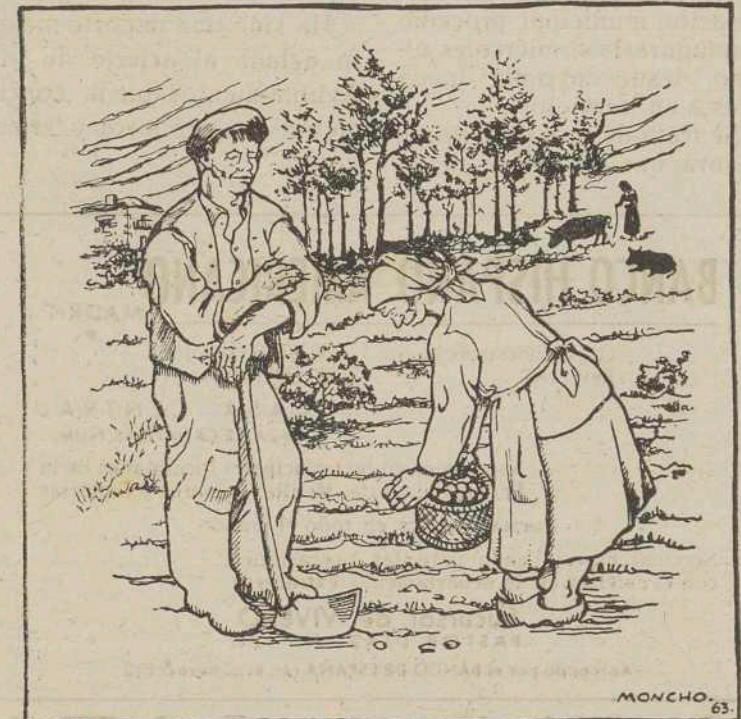
—N'Alemania habrá moitas máquinas, máis o noso fillo diz que traballa coma un'ha besta...