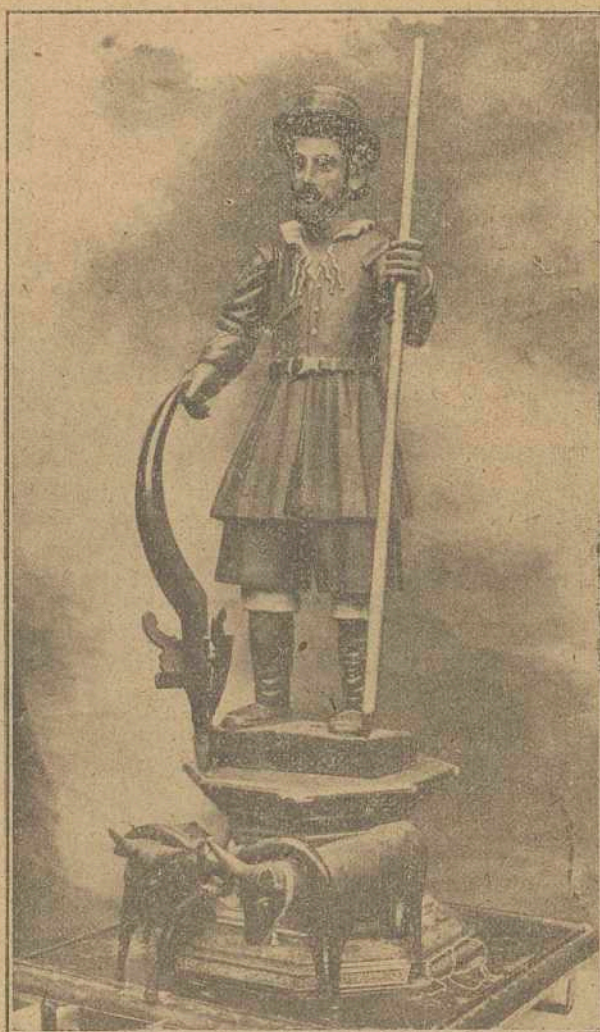
Imagen de S. Isidro Labrador, que con la de su esposa Sta. María de la Cabeza,

Era el mes de junio de 1709 y reinaba un terrible temporal, que amenazaba destruir las cosechas.