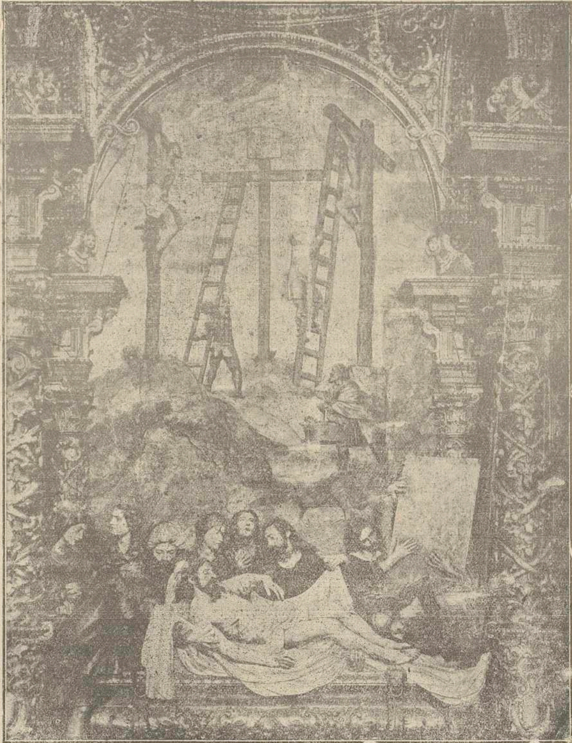
Cristo depositado en el Sepulcro