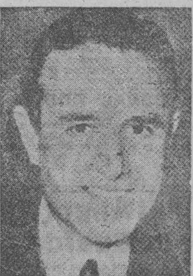
Averell Harriman, embajador de los Estados Unidos en Moscú

Se cree que no se publicará ningún comunicado hasta que hayan terminado las conversaciones