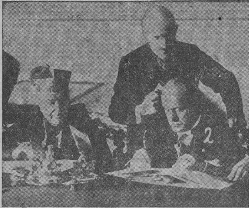
El Cardenal Gasparri y Benito Mussolini en el histórico momento de la firma del Tratado de Letrán

Se declara en él que su territorio será siempre y en todo caso considerado territorio neutral e inviolable