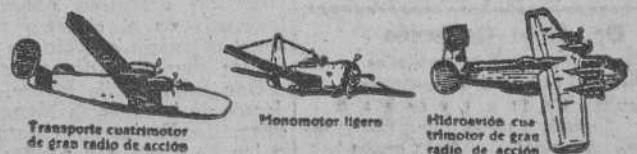
Transporte cuatrimotor de gran radio de acción

La "Consolidated Vultee Aircraft" de los Estados Unidos tiene en proyecto, para después de la guerra, la fabricación de aviones comerciales destinados a las líneas aéreas de todas las naciones.