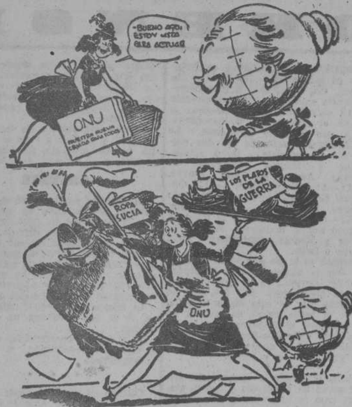
ELLA MISMA SOLICITO LA COLOCACION