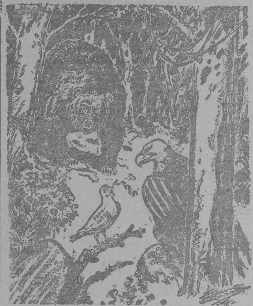
PERDIDA EN EL BOSQUE

La Paloma de la Paz, Ingenua y cordial, saluda, sin dejar caer del pico el ramo de olivo, al águila estadounidense. Ambas aves, en su respectiva actitud amistosa, no ven al ojo rojo que cautelosamente se acerca.