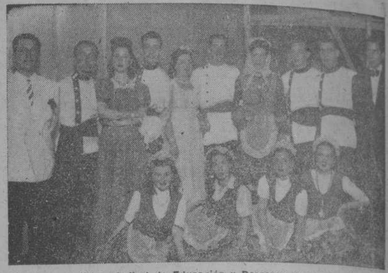
Añadidos a la Obra Sindical de Educación y Descanso que ayer participaron en la fiesta teatral con motivo del Día de la exaltación del Trabajo

PARIS, 28.—Se espera que el general De Gaulle pronuncie un discurso sobre problemas internacionales especialmente en lo que se refiere a Alemania, cuando cologie la primera piedra en el monumento a la resistencia que será erigido en Par-Le-Duc, en el departamento del Mosa, el 28 de julio.—(EFE).