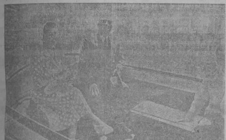
SAN SEBASTIÁN.—S. E. el Jefe del Estado y su esposa a bordo de la gasolinera en la que recorrieron la bahía.