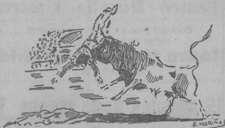
APARATOSA COGIDA DE "VITO" (Información en cuarta plana)