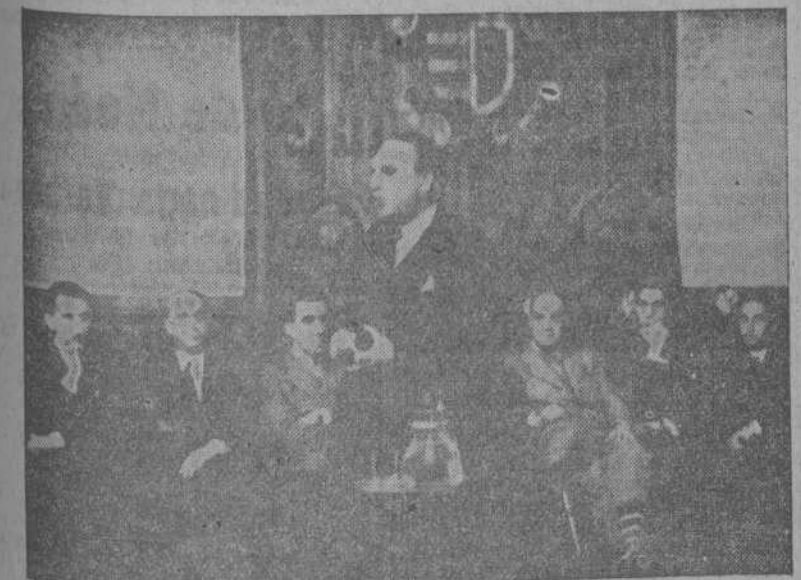
El conferenciante durante su disertación, a la cual asistieron todos los médicos de la provincia.