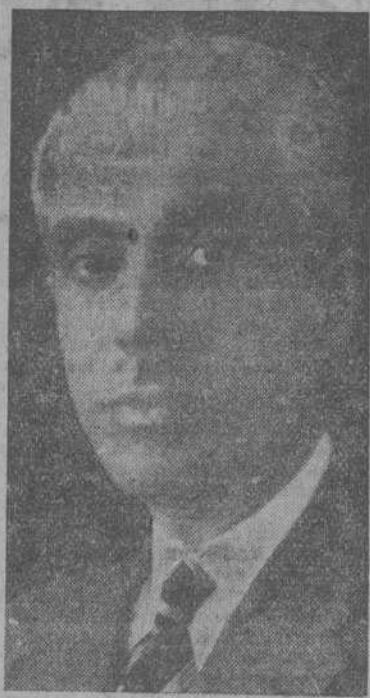
D. Teodomiro de Agullar y Salas, que ha sido nombrado por el Gobierno español Enviado Extraordinario y Ministro Plenipotenciario de España en Filipinas

ENVIADO EXTRAORDINARIO DE ESPAÑA A FILIPINAS