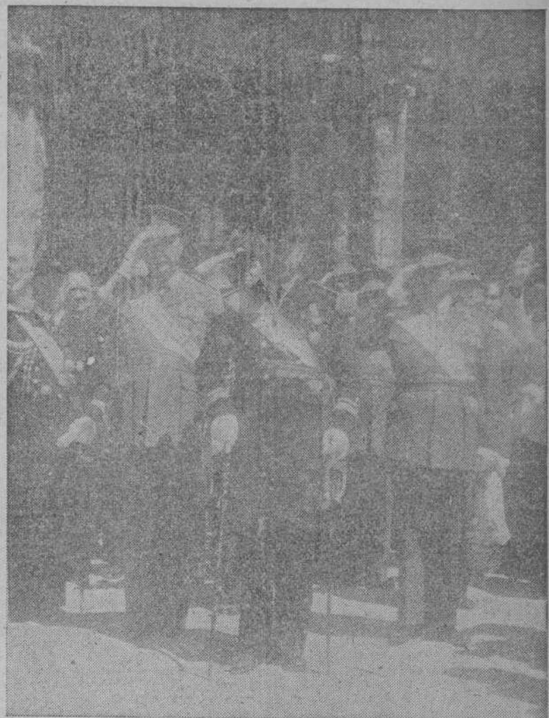
El Ministro de Marina, delegado del Caudillo, recibiendo el homenaje del pueblo santiagués, en la Plaza de España, instante antes de ponerse en marcha hacia el templo la comitiva. (Foto Arturo).

Fueron sus estímulos en esta lucha, ante todo, poner a salvo y en seguridad nuestra santa fe, amenazada; el ideal religioso, civilizador y patriótico que fué forjándose a través de nuestra existencia bajo vuestro patrocinio; rescatar el concepto de patria, atacada y vilipendiada; salvar nuestro imperio, forjado al calor de las venerandas piedras de Santiago, del Pilar y de Guadalupe. Para ello, evocamos aquellos días de poderío universal en que el nombre de España resonaba y era bendecido en los lugares más lejanos del Universo, porque la ruda de peregrinos pregonaban nuestras glorias, y los misioneros y soldados, con la Cruz de Santiago bordada en sus pechos y estandartes, se presentaban ante los pueblos como nuncios de una doctrina ecuménica de salvación. El espíritu de Santiago, que había producido el milagro de que España, al no caer en sí misma, se desbordase para alumbrar mundos, hacía tierras ignotas de leyenda, y civilizarlos y cristianizarlos, creando con ello un imperio espiritual, incomparablemente más grandioso y excelso que el de los Césares de Roma o el de Carlomagno, fué el gran motor de esta gesta de liberación que cristalizó venturosamente en la gloriosa victoria conseguida y proclamada por nuestro providencial Caudillo en primero de abril de 1939. De nuevo surgió la España auténtica, la España de Santiago, la misma de hoy, que, pasadas las horas de pesadumbre, convierte de nuevo los caminos de Com-