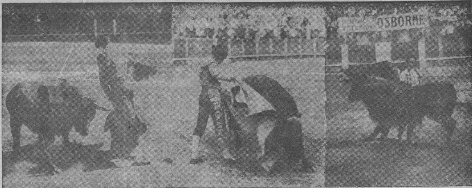
Tres instantáneas de la corrida celebrada ayer en la plaza de La Coruña. Manolete torcaudo de capa a su segundo toro del que cortó las dos orejas. Dominguí que puso la mejor voluntad para quedar bien y agradar al "respetable". Y Juanito Belmonte, pasándose el toro por la faja.

FORASTERO Con tu café... RON viejo ARVIK. 1938 Lo agradecerás