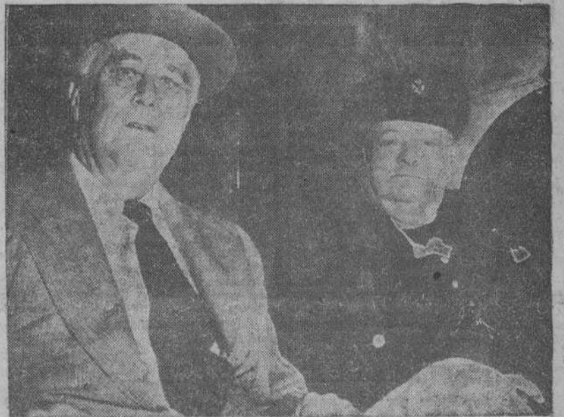
El Presidente de los Estados Unidos Mr. Roosevelt y el Jefe del Gobierno británico Mr. Churchill que han reanudado sus conversaciones sobre la marcha de la guerra.

NUEVA YORK, 7.—UN DESPACHO DE LA ASSOCIATED PRESS DE WASHINGTON DICE QUE HAN SIDO REANUDADAS LAS CONVERSACIONES DE GUERRA ENTRE CHURCHILL Y ROOSEVELT, YA QUE HAY MÚLTIPLES INDICIOS DE QUE SE ESPERA UN ACONTECIMIENTO IMPORTANTE. LOS OBSERVADORES CREEN QUE ESTE ACONTECIMIENTO SE PRODUCIRA EN ITALIA.—(EFE.)