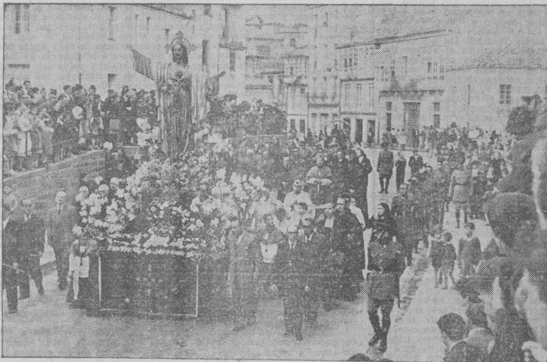
Desfile de la carroza con la imagen del Sagrado Corazón de Jesús

El señor Cardenal bendice la nueva iglesia parroquial de Puente del Puerto Homenaje del Frente de Juventudes al Prelado