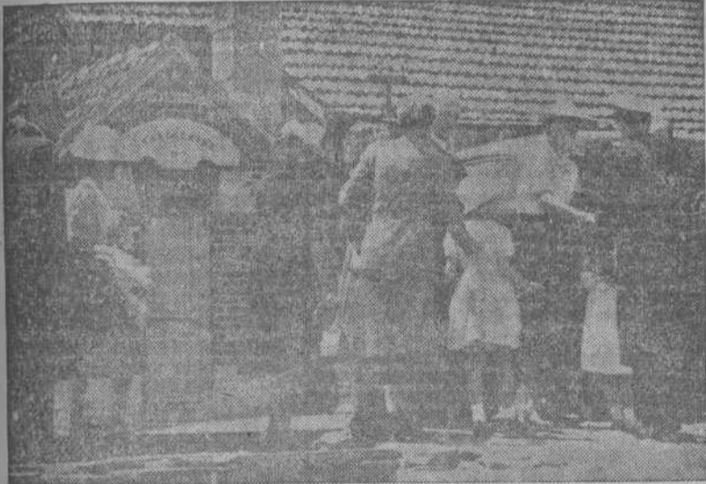
La Princesa María José, esposa de Humberto II de Italia, a su llegada a Lisboa, acompañada de sus hijos.