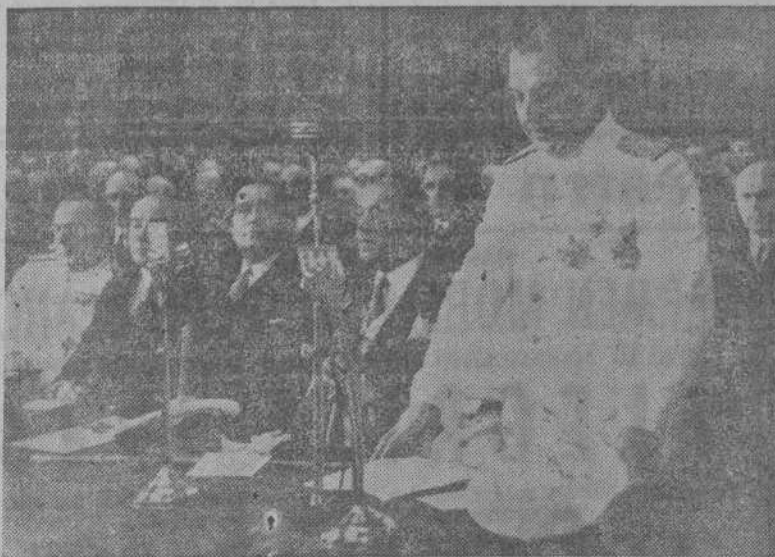
BARCELONA.—El Ministro de Industria y Comercio, señor Suanzes, durante su discurso en el acto de inauguración de la Feria Internacional de Muestras de Barcelona.