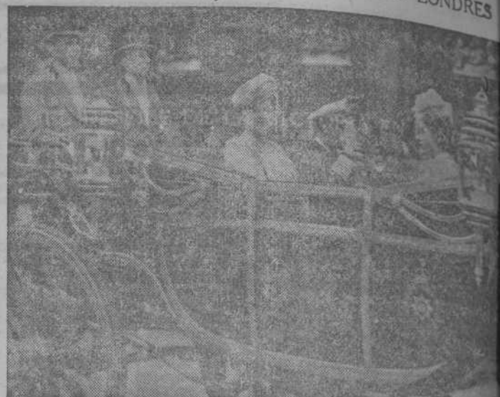
LONDRES.—Su Majestad el Rey Jorge V y su esposa, con las Princesas, dirigen a presenciar el Desfile de la Victoria