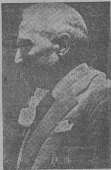
El Presidente italiano De Nicola

CIUDAD DEL VATICANO, 31. — Esta mañana el Sumo Pontífice Pío XII ha recibido en visita oficial a S. E. Enrique de Nicola, jefe provisional del Estado italiano. El presidente venía acompañado de De Gasperi, presidente del Consejo de Ministros y secretario de