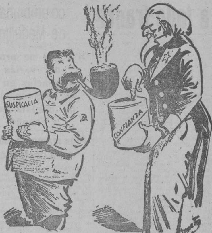
¿Qué le parece si mezcláramos esto?