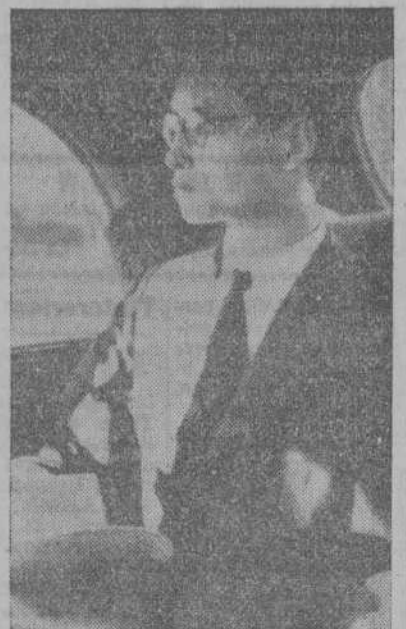
El nuevo Rey de Siam, Fumifo Adundet, hermano de Ananda Maydol, asesinado en su patria, a su llegada a Suiza donde va a estudiar en una Universidad.