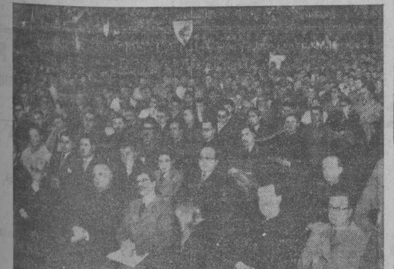
BUENOS AIRES.—Un aspecto de la concurrencia al Congreso de la Juventud Católica, con asistencia de los representantes del Brasil, Chile y Perú..