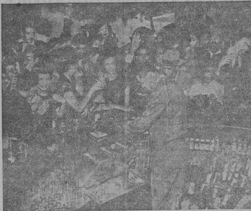
No solamente el púgil gana miles de dólares con sus puños, sino también en el bar que ha montado en Harlem, el famoso barrio negro de Nueva York. Aquí vemos al campeón del mundo de boxeo, festejando con sus parroquianos su reciente triunfo sobre Mauriello en el Yankee Stadium, y sirviéndoles personalmente.