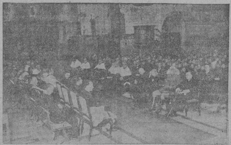
SANTIAGO.—Aspecto de la iglesia de San Martín, durante la apertura de curso en el Seminario conciliar. (Información en quinta plana).