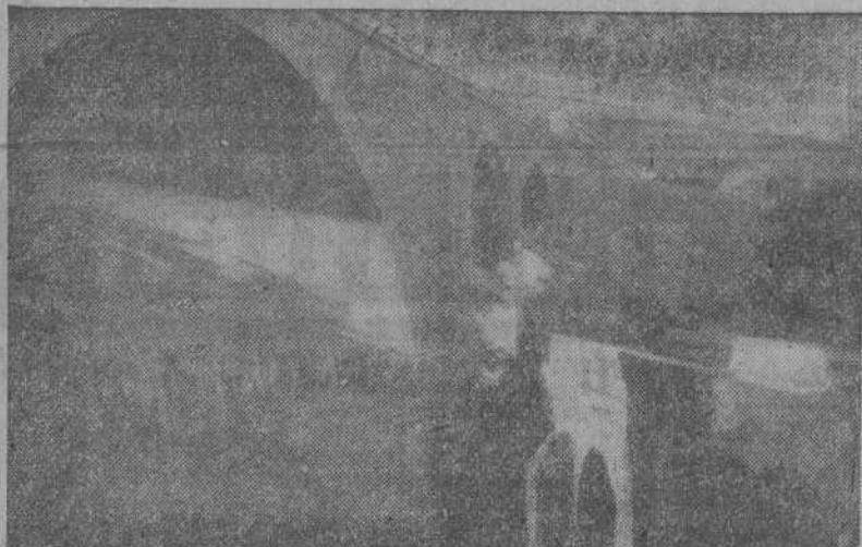
Variante del camino nacional de Vegadeo a Pontevedra, en la estación de Lalla. Obsérvese el puente antiguo, por encima del cual va el de la nueva línea férrea, sobre el río Deza

MADRE: No pongas en peligro la salud de tu hijito. El día 1 de octubre, y en homenaje al Caudillo, la Sección Femenina celebrará un acto contra la Mortalidad Infantil. No dejes de asistir, y nos lo agradecerás.