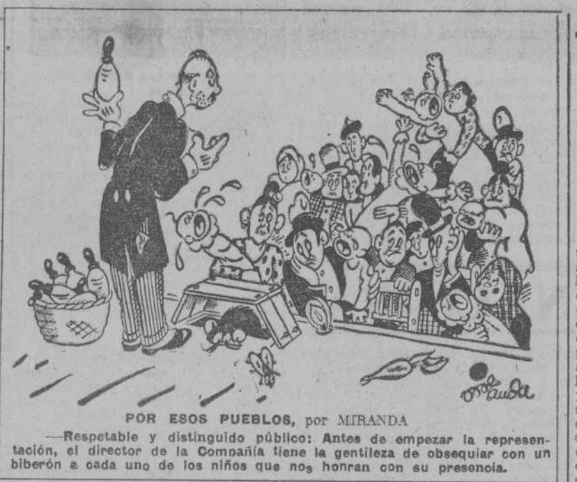
POR ESOS PUEBLOS, por MIRANDA —Respectable y distinguido público: Antes de empezar la representación, el director de la Compañía tiene la gentileza de obsequiar con un biberón a cada uno de los niños que nos honran con su presencia.