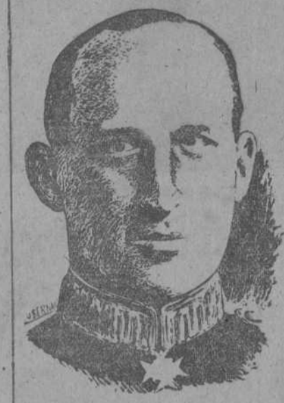
JORGE II DE GRECIA

Hoy hará su entrada solemne en Atenas Dimitió el Regente Damaskinos