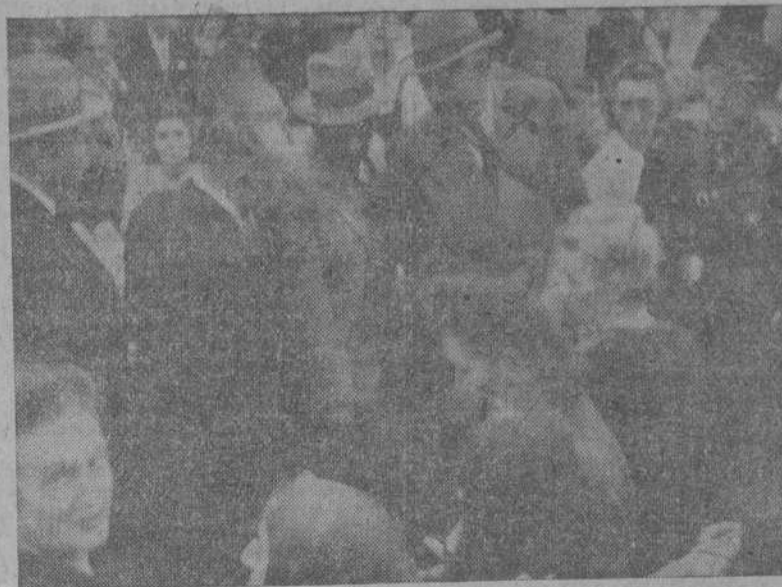
El embajador inglés en España visitando los mercados coruñeses acompañado del Alcalde y otras personalidades