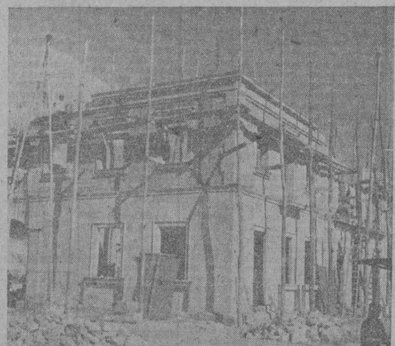
La estación de Carballino, en la actualidad ya terminada