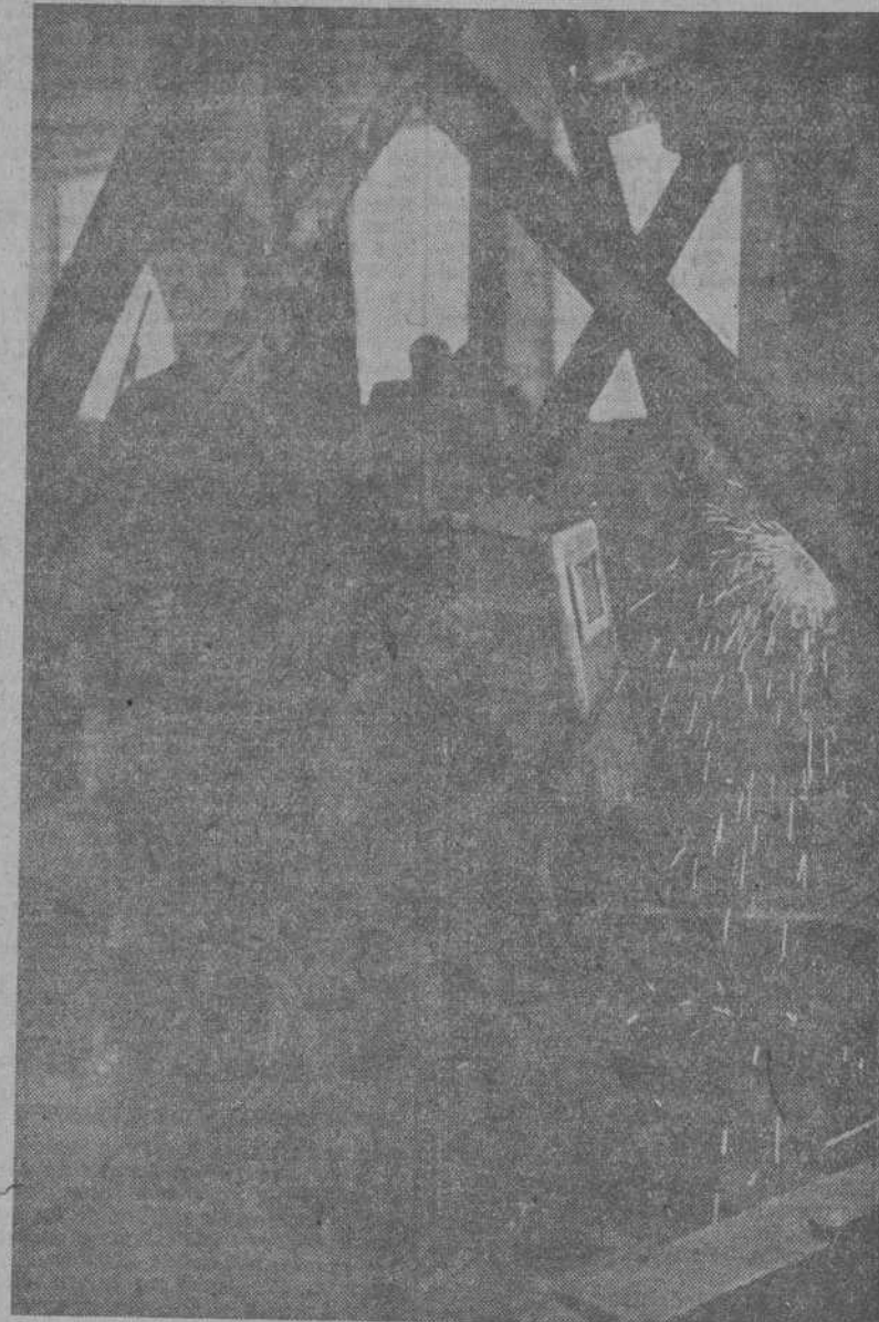
Obrero metalúrgico dedicándose a los trabajos de soldadura en uno de los puentes sobre el Miño

obras se utilizan cuatrocientas caballerías. Hace muy poco recibimos veinticinco vagones de piensos. Para dar una idea de la posibilidad de intensificar los trabajos, bastará decir que hoy se emplean unas ciento cincuenta toneladas de cemento al mes cuando la capacidad de la obra puede absorber mensualmente setecientas. Venidas algunas pequeñas dificultades existentes y suponiendo que