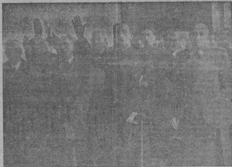
Las Autoridades coruñesas ante la Cruz de los Caídos, después del solemne funeral celebrado en sufragio de José Antonio, en la iglesia conventual de Santo Domingo