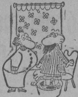
—¡Esto es insoportable, Emilia. Todos los años me pones el agua hirviendo!