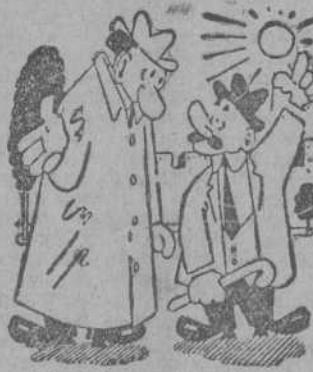
—¡Pobre tío suyo! ¿Y no saben de lo que ha muerto? —No, señor; no se lo ha querido decir a nadie.