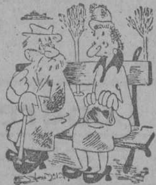
—En mi casa somos dos. Un muchacho y una muchacha. El muchacho soy yo.

FRANFORT, 20.— Un oficial del Ejército norteamericano ha disparado un tiro, produciéndole la muerte, al capitán de su compañía, en Bebra, cerca de Kassel.