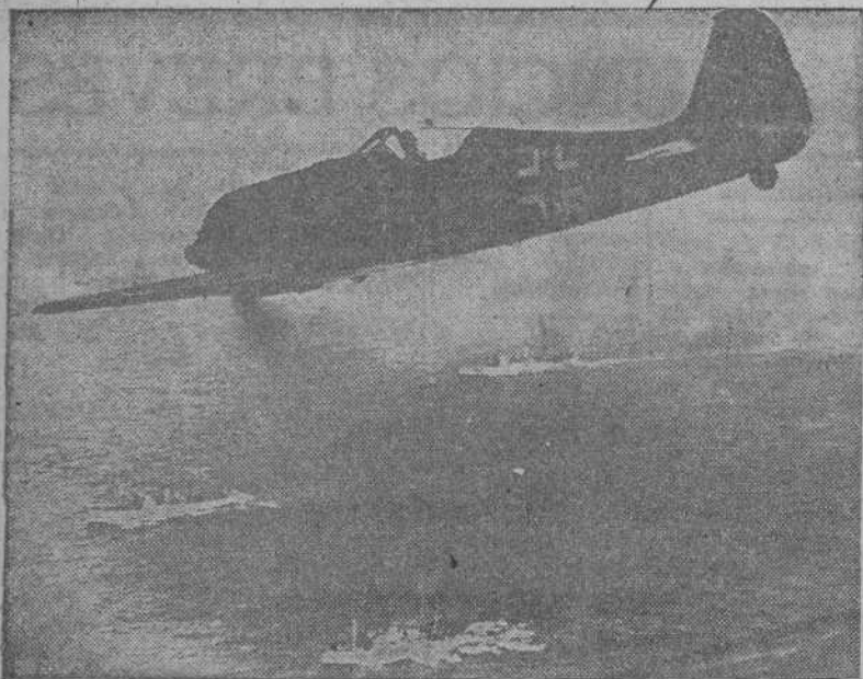
En sus últimos comunicados el Alto Mando del Ejército alemán dió informaciones sobre los grandes éxitos de los cazas alemanes "Focke-Wulf" en el Canal. Vemos aquí a un avión del tipo F. W. 190, el caza más rápido del mundo, volando sobre un convoy enemigo.

DE INSUPERABLE CALIDAD COÑAC SOLERA BERNALDO DE QUIROS