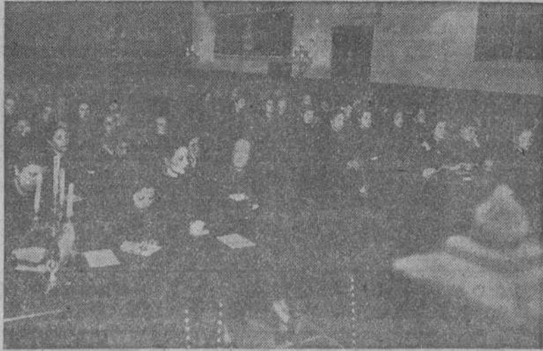
Santiago.—Aspecto del salón de Fonseca durante una de las sesiones del VII Consejo Nacional de la Sección Femenina