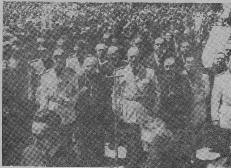
Presidencia de la peregrinación regional del Magisterio