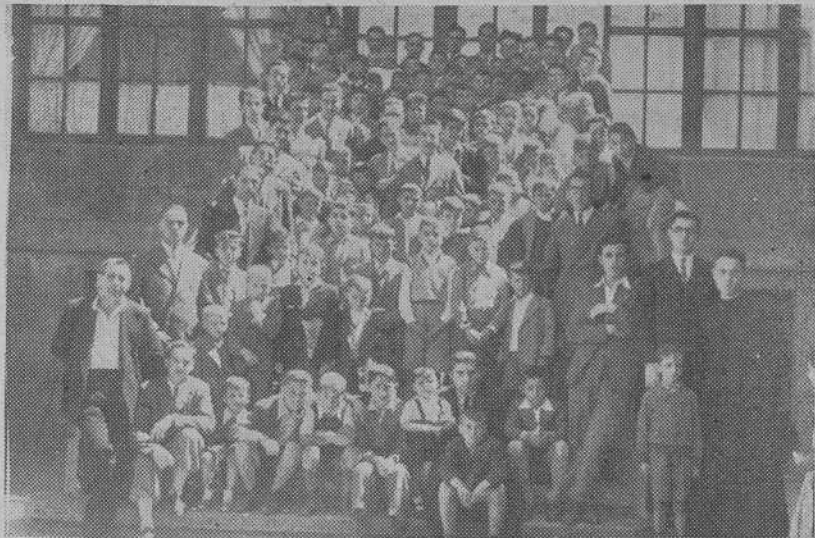
Niños del Catecismo de Santa María la Mayor del Sar (Santiago) que acompañados por el señor Cura párroco, realizaron una visita a la Grande Obra de Atocha

Como fin de curso y premio de asistencia y aplicación un grupo selecto de niños de los catecismos de Sar (Santiago), acompañados del dinámi-