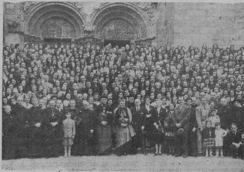
Peregrinantes bilbaínos que han ganado el Jubileo compostelano recientemente