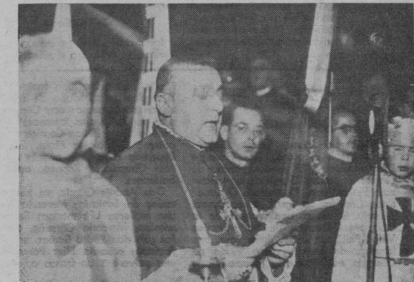
El Obispo de Mondoñedo haciendo la Ofrenda en la peregrinación de su Diócesis