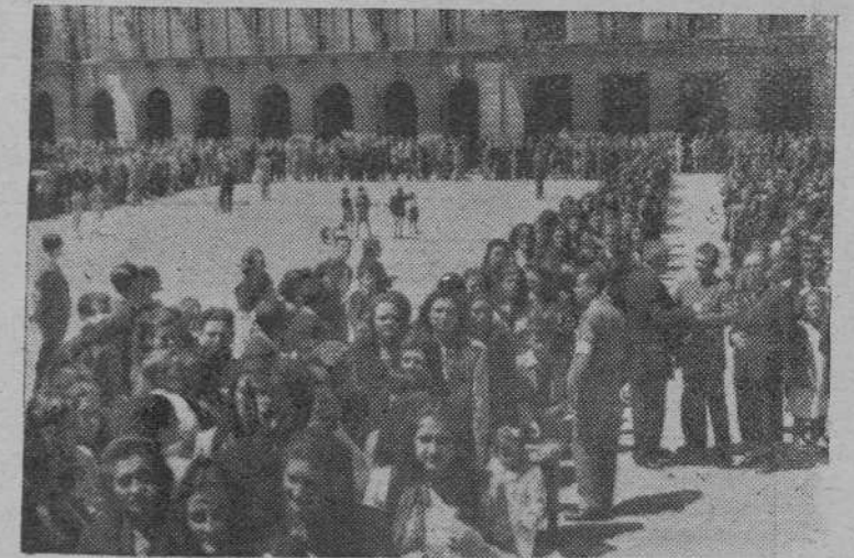
La peregrinación de la R. E. N. F. E. integrada por 4.000 peregrinos, en su recorrido ha a la Catedral