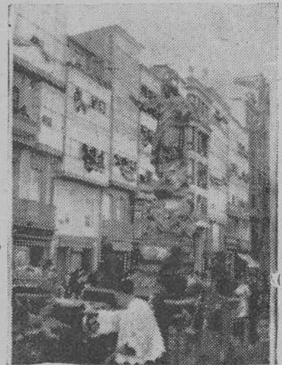
La imagen del Sagrado Corazón de Jesús a su paso procesional por las calles coruñesas

El alcalde, en medio de un religioso silencio, hizo la renovación de la consagración del pueblo de Santiago al Sagrado Corazón de Jesús, en la plaza de San Agustín.