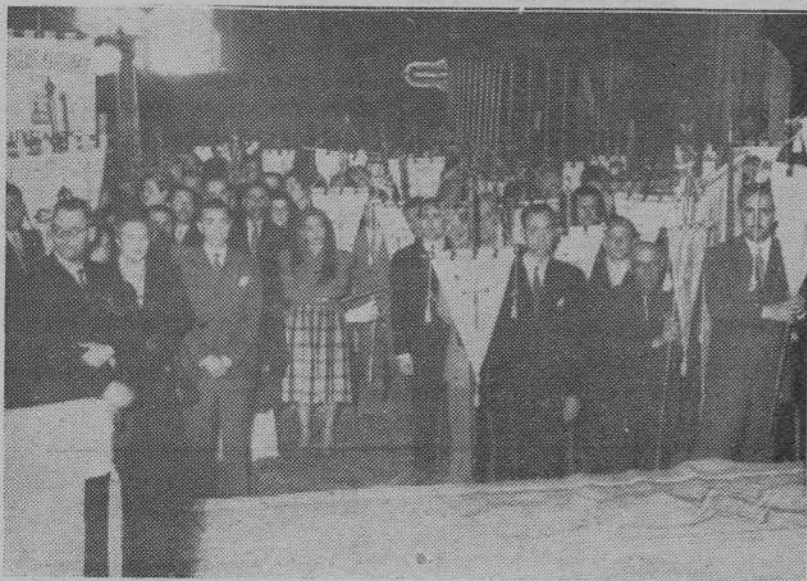
Un aspecto de la peregrinación del Magisterio en el interior de la Basílica