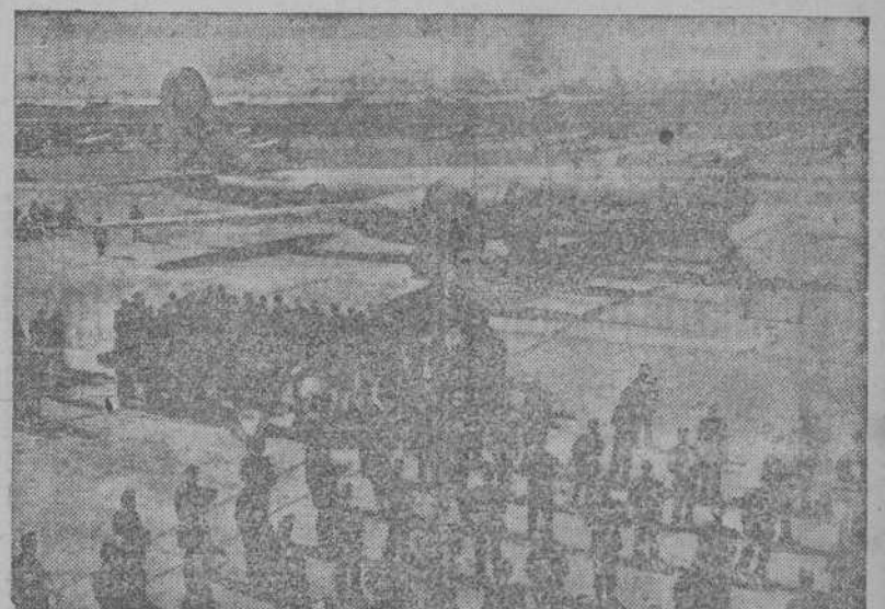
El avión "Fucus Dreamboat", que recientemente batió el "record" de distancia, volando entre Hawai y Egipto, pasando por el Polo Norte. En la foto, aparece la superfortaleza a su llegada a Washington, donde fué recibida la tripulación con todos los honores.