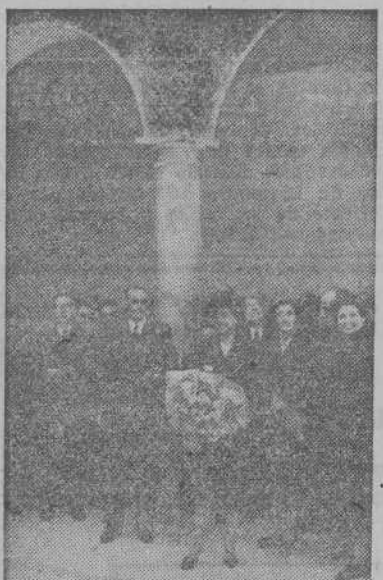
MADRID.—La esposa del Caudillo, doña Carmen Polo de Franco, con su hija, el Ministro de la Gobernación y otras personalidades, durante la inauguración del Hogar-Escuela de Auxilio Social "Batalla del Jarama", en Paracuellos.

res de tres de las mayores Casas editoriales de Europa, en Leipzig, para trasladar la maquinaria a Rusia.