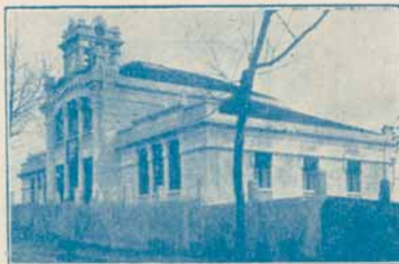
Fachada del grupo escolar Sada y sus contornos

Por las calles no se puede andar, ríos de gente, tranvías y autos. El automovilismo se impo-