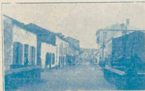
SADA Calle de Linares Rivas

Consignamos, pues, aquí, nuestra gratitud al público, a quien procuraremos continuar sirviendo dentro de las normas de una desvinculación absoluta en lo que atañe a informaciones y campañas en defensa de intereses generales de esta comarca, cuyo nombre llevamos.