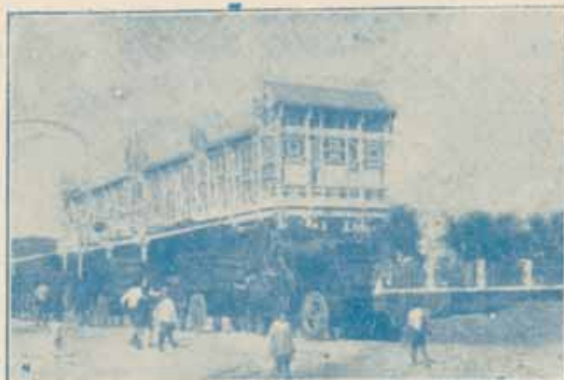
Caravana de carros del país pasando por el muelle, frente al restaurant LA TERRAZA