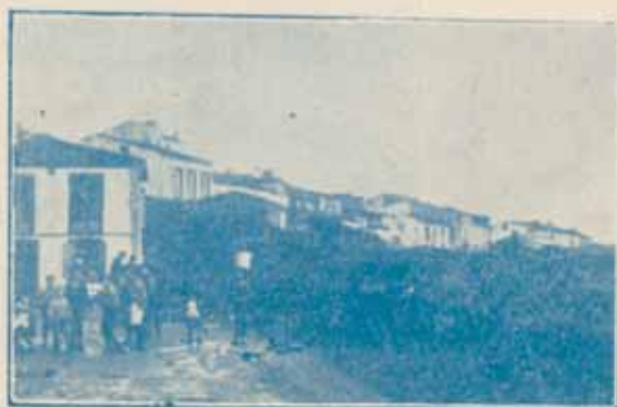
Plazuela del barrio de Fontán

Pescábamos al palangre, a un milla de la costa de Ortegá y frente a la punta Agudela y peña Fouciña, y nos cogió lo más fuerte del temporal. Cuando quisimos escapar ya no había tiempo: luchamos más de dos horas, y yo, cada vez que una ola reventaba encima de nosotros, ni siquiera me agachaba. Más ligero y mejor nadador que el resto de mis compañeros y porque Dios lo quiso, pude agarrarme como una lapa a la quilla del bote; el patrón se quedó debajo y tuve que hacer un esfuerzo para desengancharlo y quitarlo a flote sobre la quilla. Idéntica operación tuve que realizar con el rapaz; así permanecimos dos horas, que nos parecieron siglos, pues es difícil de contaros la lucha que sostuvimos con las indómitas olas. Las doce de la noche eran cuando