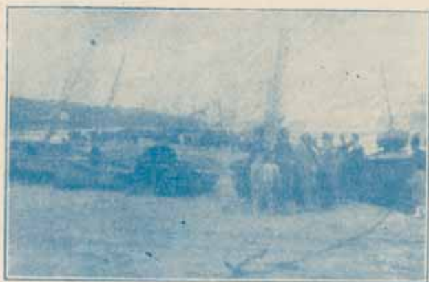
Descargando • patexo •

Se despidió de Sada con una tramontana fría y tempestuosa y una lluvia incesante, tenaz, que convirtió el poblado en lodazal inmenso; voló después el viento hacia el gregal y fué recorriendo el cua-