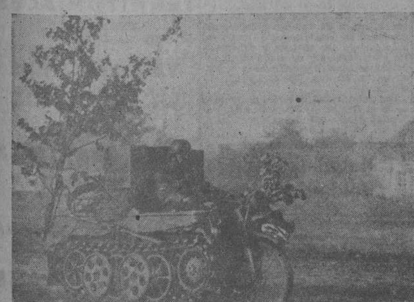
La motocicleta aruga, formidable invento alemán, en plena actuación en el Este, facilita notablemente el avance a los motoristas alemanes a través de los malos caminos rusos. La fotografía muestra una de estas motos aruga avanzando, detrás, lleva un arbolito que le sirve de camuflaje.

VICHY 22. —Un intenso combate se desarrolla en Mahity, en Madagascar, con activa participación de la artillería francesa. Así se anuncia oficialmente con datos recibidos de Tananarive.