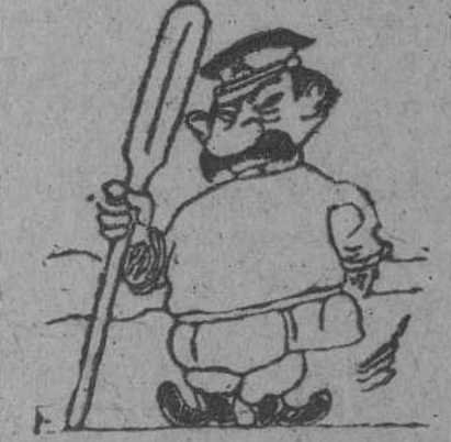
VOLGA, VOLGA! por GALINDO