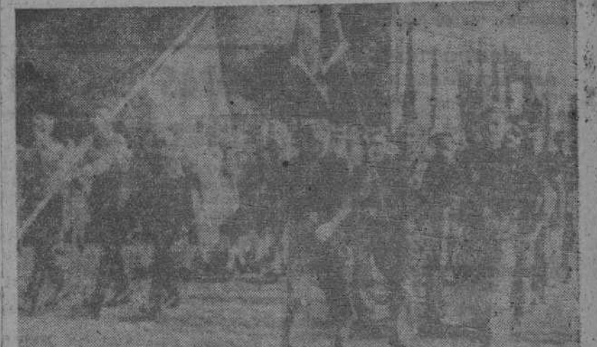
VIENA. Camaradas del Frente de Juventudes de España desfilando en compañía de las demás representaciones que han asistido al Congreso de Juventudes europeas.