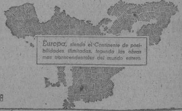
Europa, siendo el Continente de posibilidades ilimitadas, inspira las obras más trascendentales del mundo entero.

Debido a este genial invento, el Arte Gráfico ha llegado hoy día a obtener una perfección completa que se refleja en la maquinaria moderna, como por ejemplo: Una rotativa de fabricación alemana del año 1942 que imprime de un sólo movimiento 64 páginas en multicolor, pesando la instalación total de esta rotativa 200.000 Kgs.