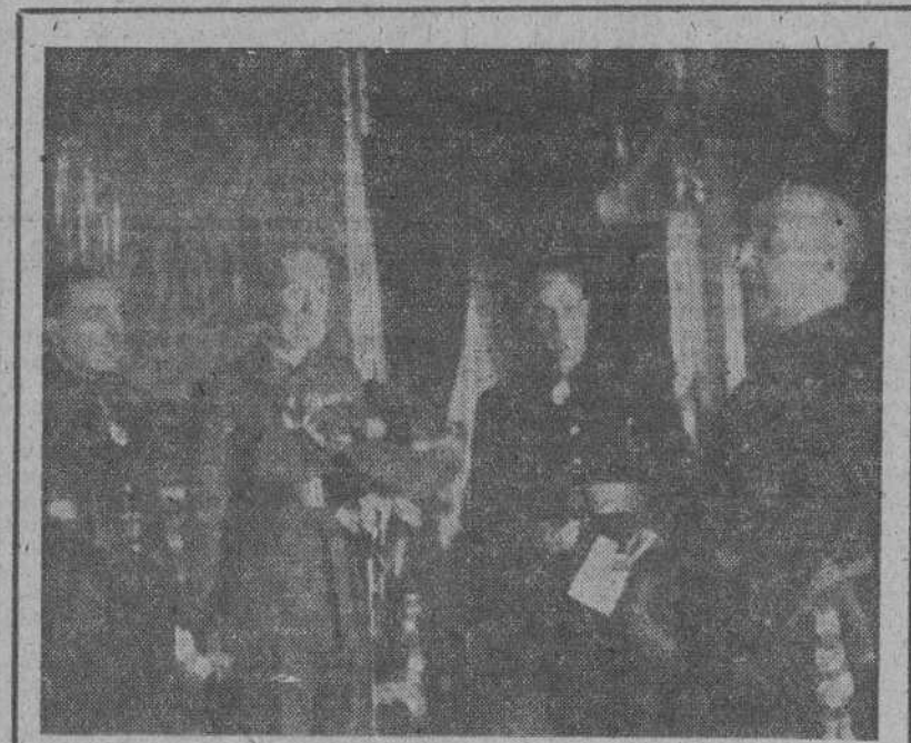
El Presidente y miembros de la Gestora Provincial de Madrid entregan a S. E. el Jefe del Estado, en El Pardo, la cédula de honor.

En la misma Orden se obliga a que en las facturas se especifique el precio que regía en el año 1936 con las bonificaciones, que entonces se hicieron y el nuevo precio actual aplicado al porcentaje. Es la única manera de que el comprador pueda comprobar si el precio que señala el industrial como del año 1936 es real o ficticio, facilitando así la tramitación de las reclamaciones ante la Fiscalía de Tasas. El Estado, como se ve, no olvida ninguno de los factores que intervienen en la vida del país a los que procura ordenar en el conjunto del supremo interés nacional respetando y protegiendo en cada caso al mismo tiempo el de los particulares.