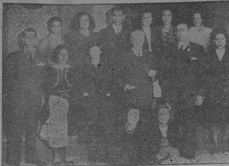
Alumnos de la Escuela de Artes y Oficios Artísticos que salieron a efectuar una excursión artística a León y Lugo.

ACADEMIA C.C.C. Centenario, 6. SAN SEBASTIAN