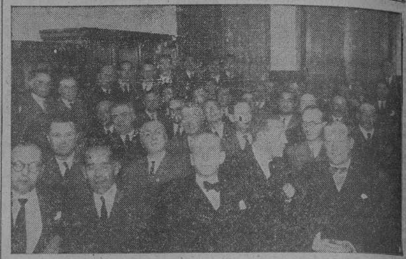
Un aspecto del salón de sesiones del Colegio Médico, durante una de las conferencias del cursillo que actualmente se efectúa en nuestra ciudad.

Ya tendremos al corriente a nuestros lectores de todo el programa de ese día.