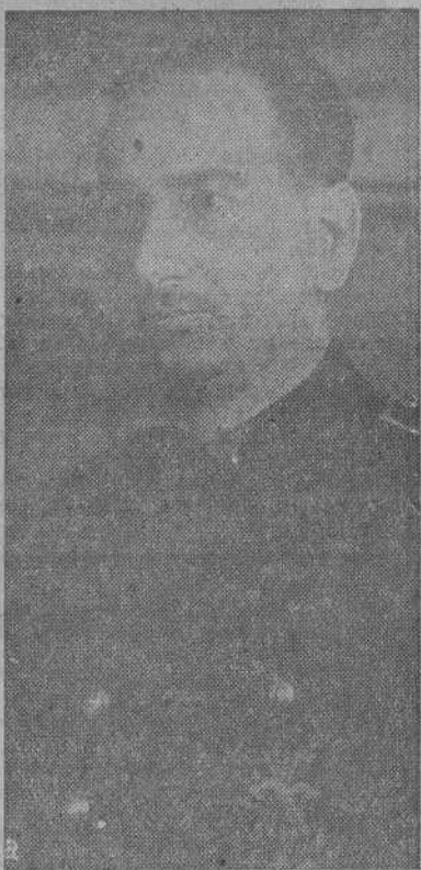
El Excmo. Sr. D. José Luis de Arrese. Ministro-Secretario General del Partido

Quizá de todos ellos, lo que más interesa resaltar son los conceptos falangistas de considerar al empresario, al técnico y al obrero, como hermanos en la gran empresa de la Patria, y al Estado con el encargo de velar por ellos como fuerza integrante de su mecánica directiva; porque sin esta unidad de los hombres de España y sin esta asistencia de la función go-