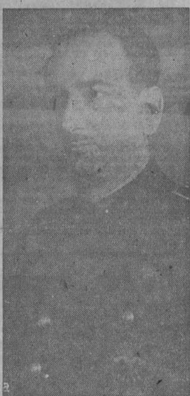
El Excmo. Sr. D. José Luis de Arrese. Ministro-Secretario General del Partido

Quinés de todos ellos, lo que más interesa resaltar son los conceptos falangistas de considerar al empresario, al técnico y al obrero, como hermanos en la gran empresa de la Patria, y al Estado con el encargo de velar por ellos como fuerza integrante de su mecánica directiva; porque sin esta unidad de los hombres de España y sin esta asistencia de la función go-