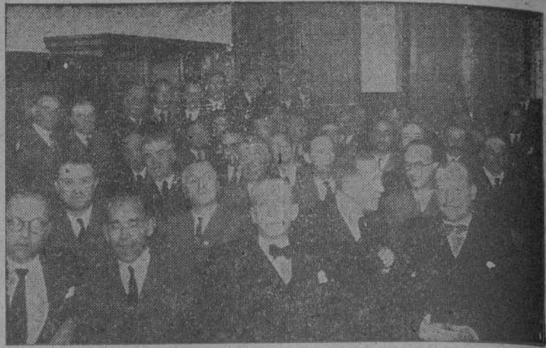
Un aspecto del salón de sesiones del Colegio Médico, durante una de las conferencias del cursillo que actualmente se efectúa en nuestra ciudad.

Hoy continuarán los actos de dicho cursillo.