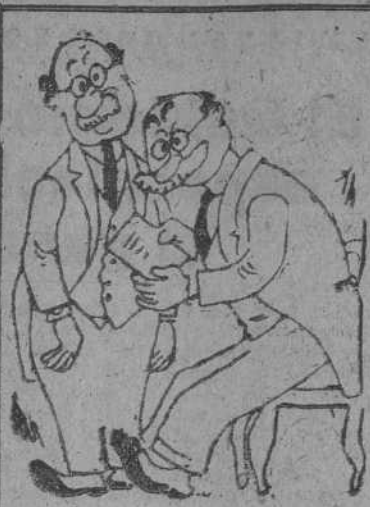
LA CARTA DE STALIN Por Galindo —Ha escrito los nombres propios con letras minúsculas. —En cambio la nerviosidad es mayúscula.

BERLIN, 22.—Los aeródromos de Lucca y Halfar, en la isla de Malta, han sido nuevamente bombardeados