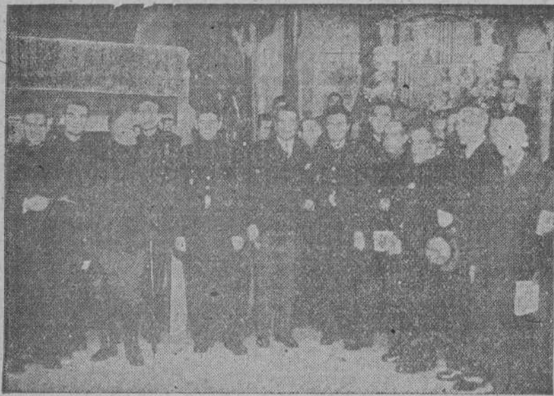
Autoridades, jerarquías del Movimiento y representaciones, en el acto inaugural de la I Exposición de Arte organizada por Educación y Descanso, en el salón de la Reunión de Artesanos, de La Coruña

Ha sido inaugurada con asistencia de autoridades y jerarquías