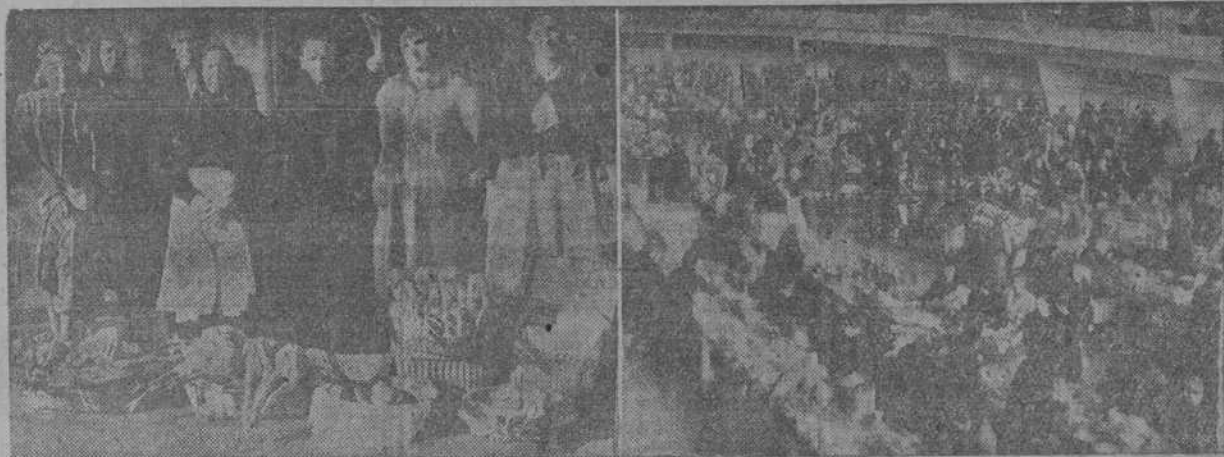
Un aspecto del mercado de San Agustín de La Coruña, durante la venta de hortalizas y legumbres propias para el consumo en estos días de Pascuas. Tampoco faltan en abundancia los capones y pollos. Ahí los tienen ustedes en plena vía pública, como si acabasen de ser desplumados por un "auto"