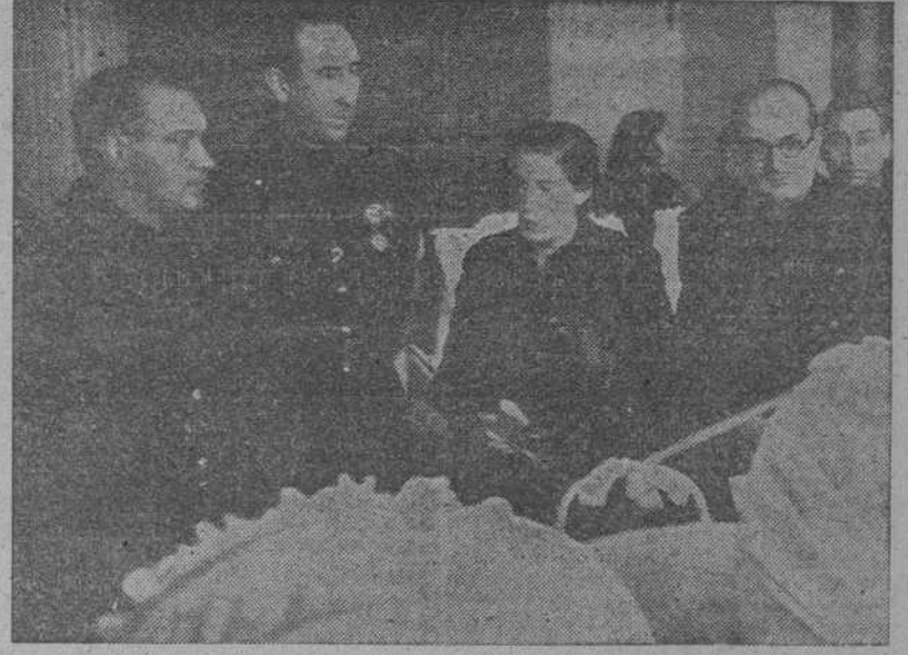
En el Teatro del Circulo de Bellas Artes, de Madrid, se celebró el acto de clausura de la segunda parte del plan formativo para la mujer, de la Sección femenina. En la foto, el ministro de Educación Nacional, con la Delegada Nacional de la Sección Femenina y otras personalidades visitan la Exposición