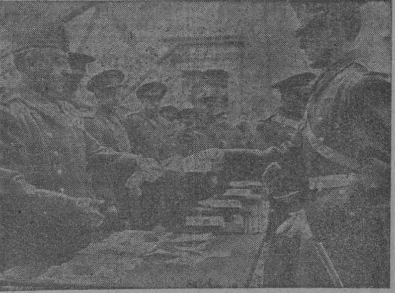
En las gloriosas ruinas del Alcázar de Toledo y con asistencia del Caudillo se celebra la imposición de fajas a los jefes y oficiales diplomados de Estado Mayor y entrega de los Despachos a los tenientes del Ejército que han terminado sus estudios en las Academias Militares de Transformación. En la foto, el Caudillo entrega los despachos.

LONDRES 23.—“Existe una razón dice el “Times”—para dispensar buena acogida al acuerdo de Lisboa. Las ententes regionales entre los Estados europeos vecinos podrían jugar aún un papel precioso en la reconstrucción y renovación del orden europeo después de las tempestades destructivas que han arrasado sus cimientos.”—(EFE).