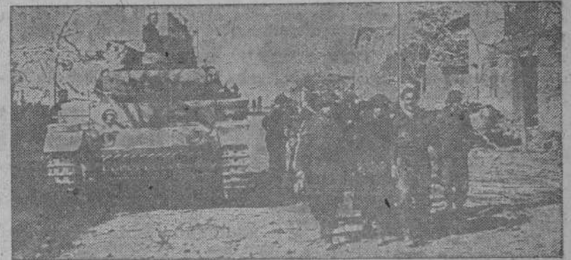
En recientes combates librados en el sector tunecino, los soldados alemanes hicieron prisioneros a varios destacamentos de soldados norteamericanos, que han sido conducidos al campo de concentración

Imposición de la Cruz de Hierro a un voluntario de la División Azul