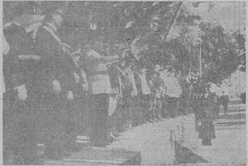
El ministro secretario general del Partido, camarada Arrese, preside el desfile militar celebrado después de la coronación de Nuestra Señora de la Victoria, Patrona de Málaga.

Después de una breve detención en Cáceres, Arrese regresó a Madrid