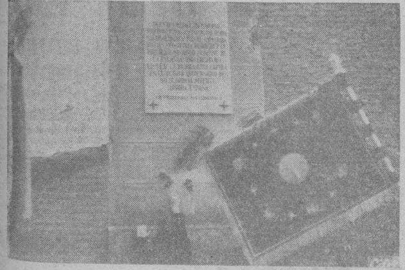
El Día del Estudiante Caído se colocó una lápida en el lugar de la calle de Mendizábal, de Madrid, donde cayó Matías Montero (Foto CIFRA).