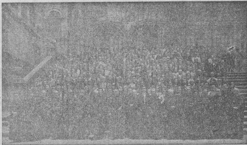
Santiago.--Los peregrinos de Valencia (unos trescientos) después de ganar el Jubileo.

SANTIAGO, 8.—Ha hecho su entrada en el día de hoy en la Catedral una peregrinación compuesta por cien señoritas de la Juventud de Acción Católica de Sevilla, todas ellas ataviadas con la