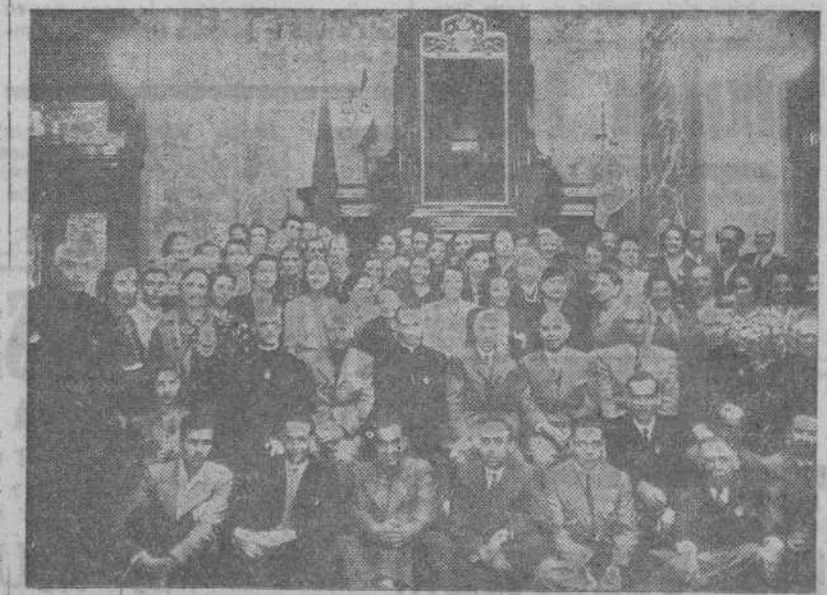
Precedentes de Santiago, estuvieron ayer en La Coruña, donde realizaron diversas visitas, los integrantes de la segunda peregrinación nacional. La foto fué impresionada en el salón de sesiones del Ayuntamiento.