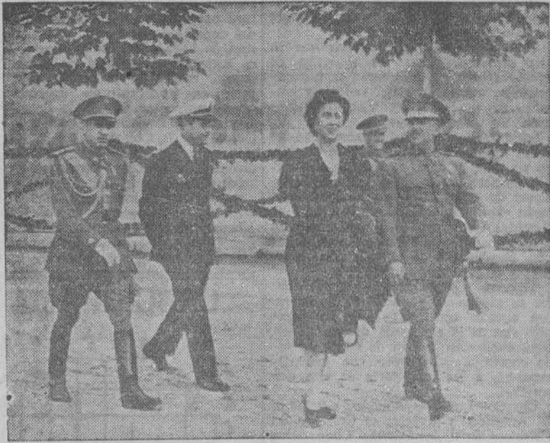
S. E. el Jefe del Estado Generalísimo Franco, asiste a varios actos en El Pardo con motivo de su fiesta onomástica