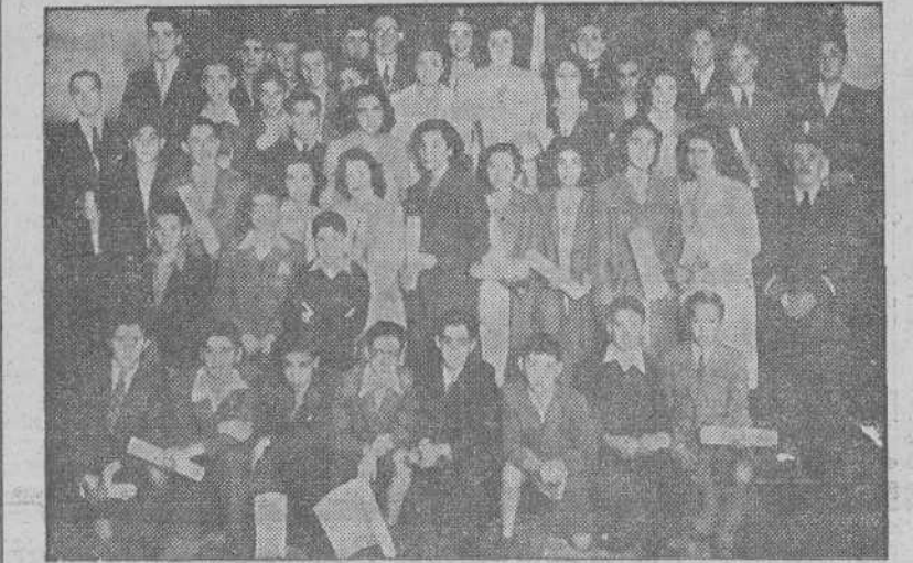
Alumnos de la Escuela de Comercio que han recibido los diplomas de premios extraordinarios en la apertura del curso celebrada ayer solemnemente