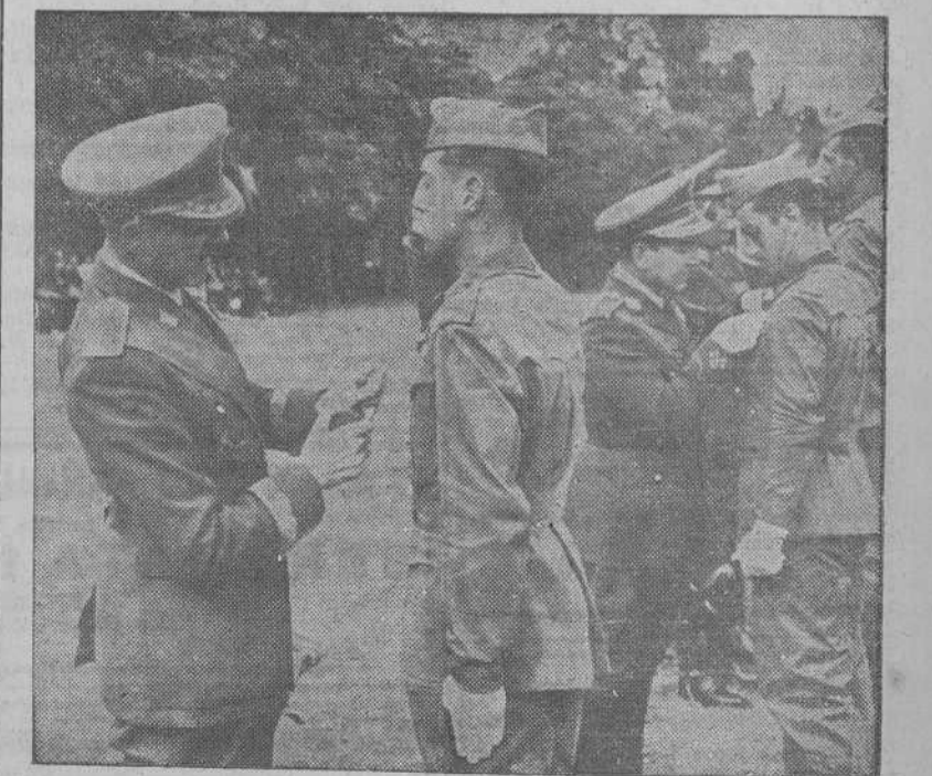
En el campamento de las Milicias Universitarias en La Granja, y bajo la presidencia del Ministro del Ejército, se celebra la solemne entrega de despachos a 977 oficiales de complemento. El general Ascensio impone personalmente las insignias a los nuevos oficiales