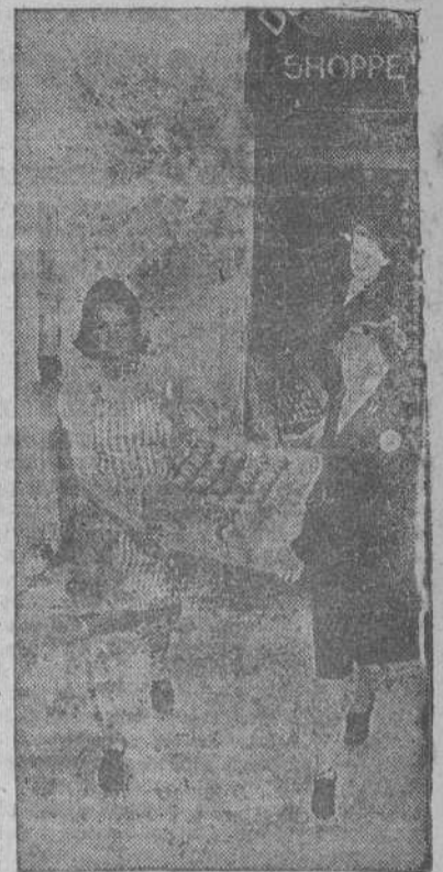
Muchachas de la Cruz Roja americana en Africa del Norte, llevando los buñuelos hechos en su improvisada cocina, a los servicios ambulantes que distribuyen café, etc., en campaña a los tripulantes de los bombarderos que regresan de cumplir misiones.