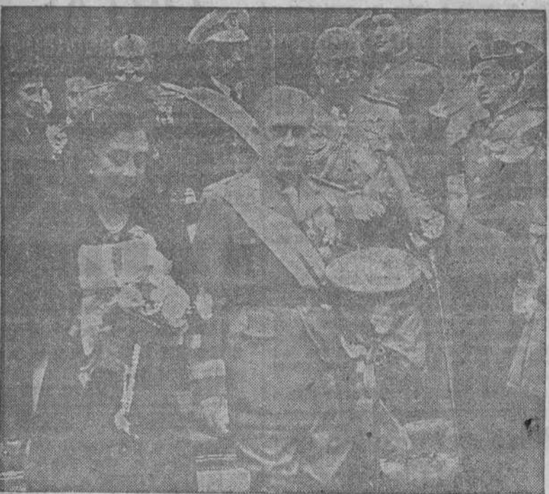
MADRID.—Doña Carmen Polo de Franco, acompañada del director general de la Guardia Civil, señor Alonso Vega, saliendo de la Basílica de la Milagrosa después de asistir a la solemne fiesta religiosa que la Guardia Civil celebró en honor a su Patrona, la Virgen del Pilar.

"Universidad católica, porque no hay ciencia ni enseñanza verdadera que pueda apartarse de quien es la suprema ciencia y la más soberana verdad, Universidad española, porque sin servir a la Patria como poderoso instrumento educador de sus hijos, su misión se falsea, y se convierte en centro subversivo, del que brotan, en lo ideológico y en lo moral, nefastas aberraciones del espíritu. Como la ciencia es una, una es también la verdad de España, y esta verdad constituye para los españoles un código sagrado en el que hay que formar a las generaciones estudiosas, so pena de un delito de lesa Patria."