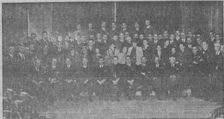
Los participantes en el Congreso Internacional de Anatomía, después de la sesión celebrada ayer en el Instituto de Enseñanza Media de La Coruña