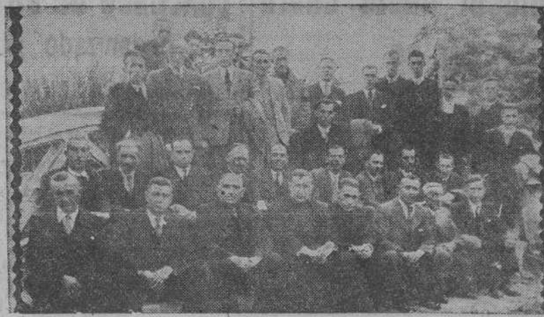
Ferrovianos de La Coruña, Ferrol, Lugo y Monforte que tomaron parte en la sexta tanda de ejercicios espirituales cerrados. Estas tandas (dos veces al mes) se celebran en la Casa de Ejercicios del Seminario de Lugo, bajo la dirección de PP. Jesuitas de la Residencia de La Coruña.