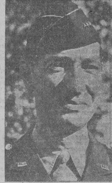
El teniente general Mark W. Clark, jefe del Quinto Ejército de los Estados Unidos