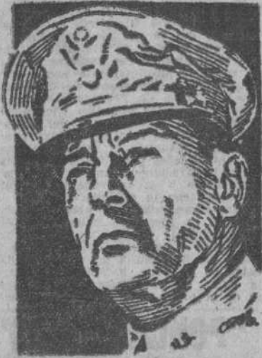
El general Mac Arthur que, al frente de sus tropas desembarcó en la isla de Luzón

El general Mac Arthur, el viernes (CONTINUA EN TERCERA PLANA)