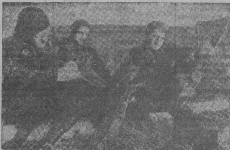
Este nuevo tipo de luchadores individuales de la Marina de Guerra Alemana, botiene heroicos triunfos. En la fotografía vemos un grupo de ellos poniéndose sus complicados uniformes