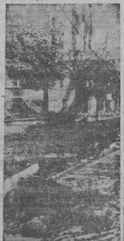
Cuando las tropas bolcheviques fueron arrojadas por los alemanes de la ciudad prusiana de Goldap, ante los soldados del Reich se ofreció este trágico cuadro: cadáveres bolcheviques, armas abandonadas en la huida, tanques y cañones inutilizados...