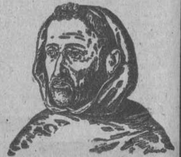
Fray Luis de León