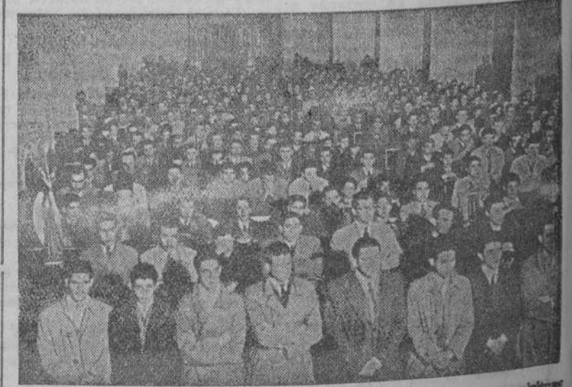
Aspecto de la iglesia del Sagrado Corazón durante los ejercicios espirituales para la juventud masculina de La Coruña. Los dirige el R. P. Parada. El lunes, día 4 de marzo, comenzarán los ejercicios para hombres. Serán dirigidos por el R. P. Pastilla.