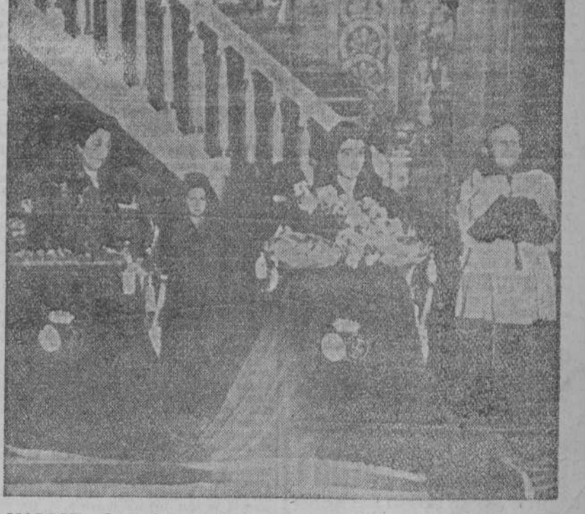
MADRID.—Con asistencia de la esposa y de la hija del Jefe del Estado, Generalísimo Franco, se ha celebrado en la iglesia de San Francisco el Grande una solemne misa, organizada por los Cuerpos Generales de Policía y de Policía Armada, en honor de su Santo Patrono, el Angel de la Guarda. Asistieron al acto también el Ministro de la Gobernación, el Director General de Seguridad y otras autoridades. Al final del acto desfilaron ante el Ministro de la Gobernación las fuerzas de la Policía Armada.

solución relativa a la consolidación del sistema norteamericano; dicho artículo primero recomienda que las conferencias interamericanas se celebren cada cuatro años, en vez de cinco, y el segundo aboga por la reunión anual de cancilleres.—(EFE.)