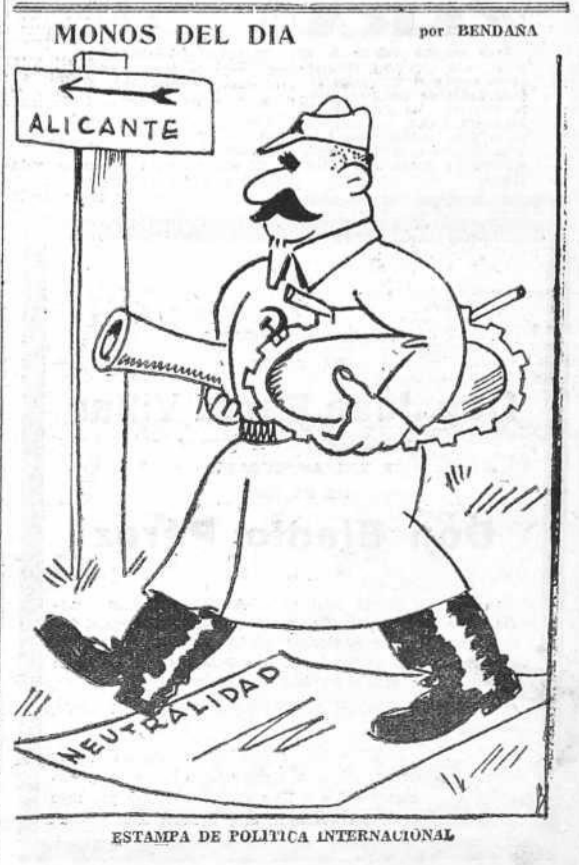
ESTAMPA DE POLITICA INTERNACIONAL