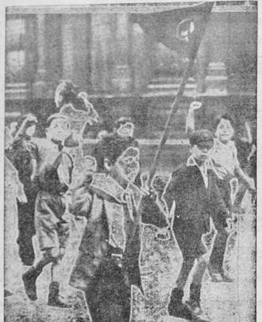
Mientras que algunos destacados políticos británicos muestran públicamente sus simpatías por los criminales marxistas españoles...

La Coruña.—Año XXI.—Núm. 5.615 DOMINGO, 4 JULIO DE 1937