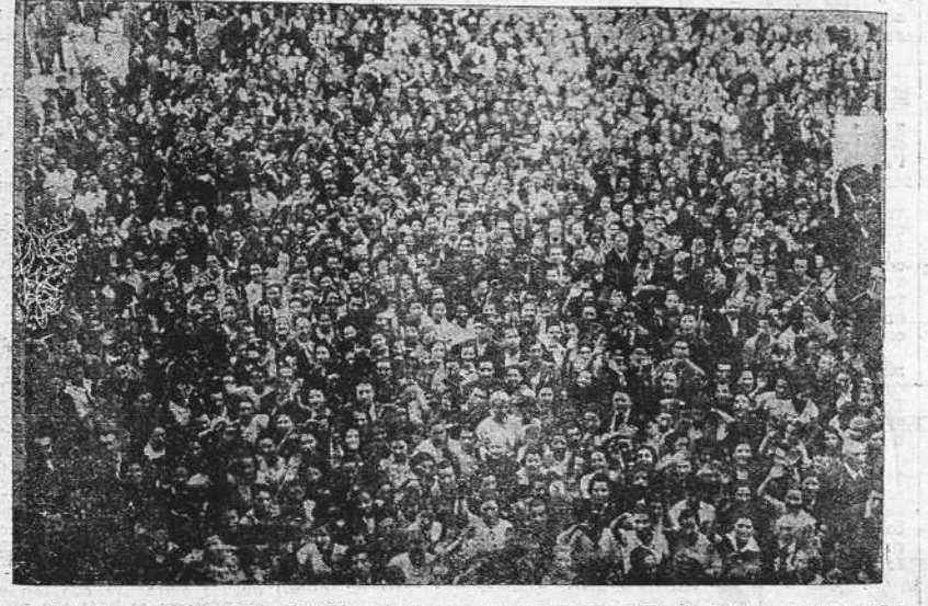
Un aspecto de la entusiasta manifestación celebrada en Santiago con motivo de la toma de Santander por las gloriosas tropas nacionales.