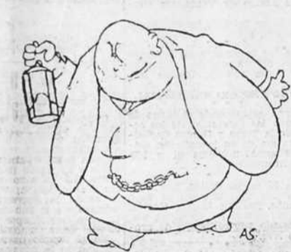
Ossorio, nuevo Diógenes, busca un cura para dedicar una misa a las potencias extranjeras.

Así se explica esta calma absoluta del frente.