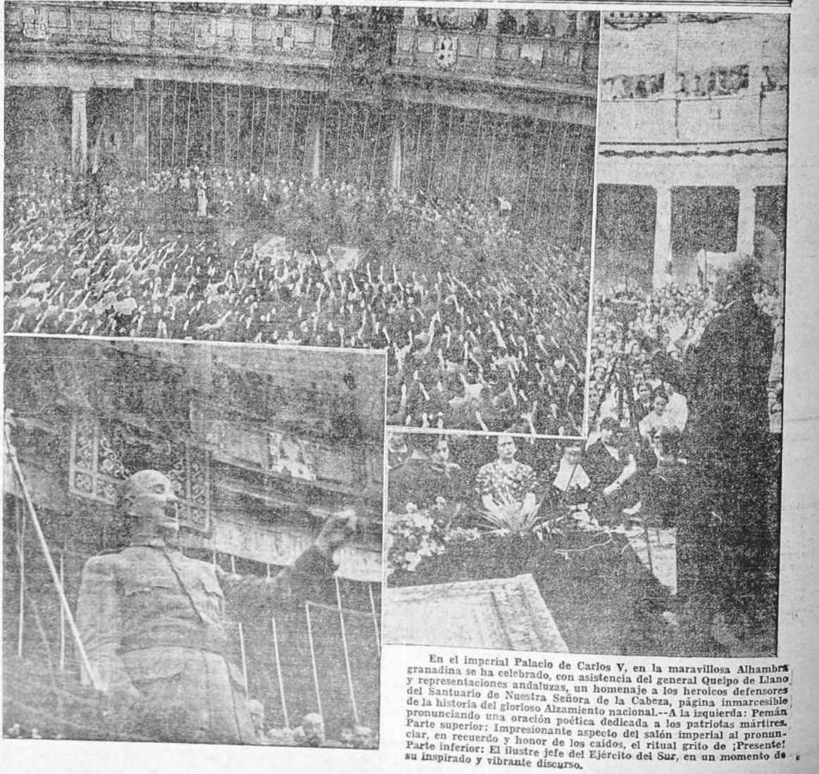
En el imperial Palacio de Carlos V, en la maravillosa Alhambra granadina se ha celebrado, con asistencia del general Queipo de Llano y representaciones andaluzas, un homenaje a los heroicos defensores del Santuario de Nuestra Señora de la Cabeza, página inmarcesible pronunciando una oración poética dedicada a los patriotas mártires. Parte superior: Impresionante aspecto del salón imperial al pronunciar en recuerdo y honor de los caídos, el ritual grito de ¡Presente! Parte inferior: El ilustre jefe del Ejército del Sur, en un momento de su inspirado y vibrante discurso.