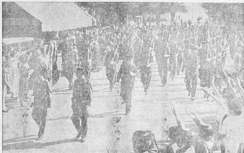
LA CORUÑA.—La Guardia Civil ha a celebrado con gran esplendor la fiesta de su Patrona. Después de los actos religiosos, las fuerzas de la Benemerita desfilaron ante las autoridades, entre grandes ovaciones del público.

Se ha publicado estos días una noticia dando cuenta del proyecto que meditan los separatistas vascos sobre ciertas películas de engorioso aspecto sentimental, que por medio de los trucos y mentiras a que son tan aficionados, sobre bombardeos aéreos e intervenciones extranjeras, hicieron propaganda contra la España Nacional.