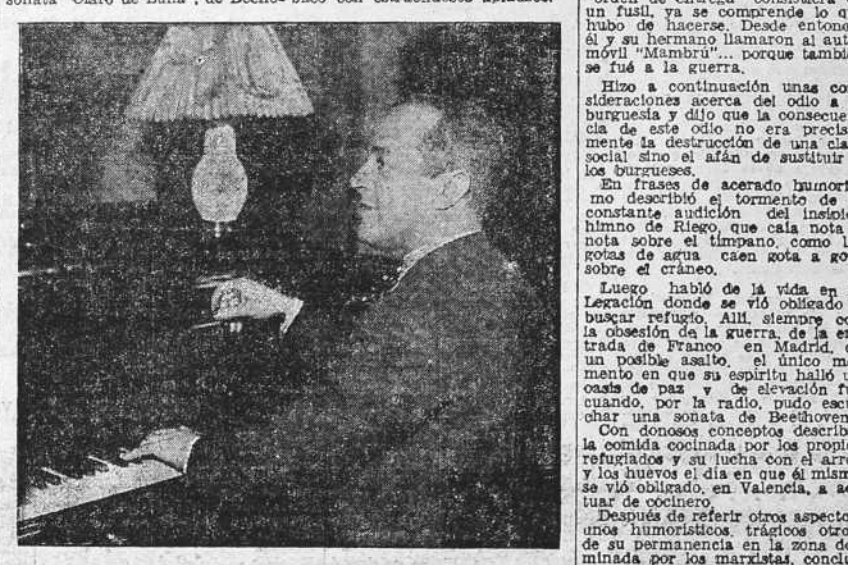
EL MAESTRO CUBILES

El público ovacionó con verdadero entusiasmo al gran humorista gallego cuando éste dio fin a su interesante conferencia.