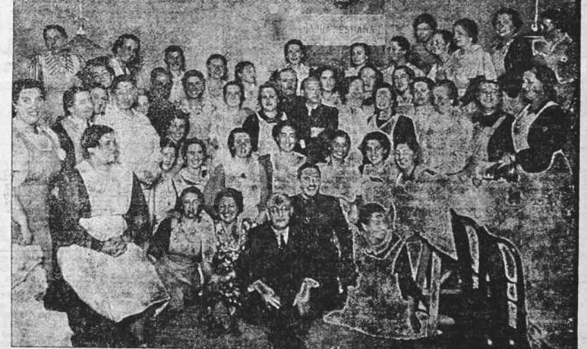
El ilustre periodista gallego Wenceslao Fernández Flórez, rodeado por las Mujeres de los Talleres de Sana Teresa, que obsequiaron a nuestro paisano con un vino de honor

Entre las dos partes de concierto, dió nuestro ilustre paisano Wenceslao Fernández Flórez su charla, que versó acerca de las penalidades por él sufridas en la zona roja.