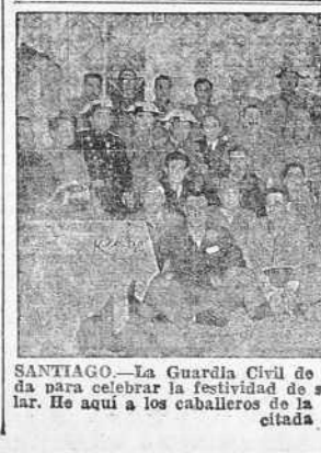
SANTIAGO.—La Guardia Civil de esta ciudad se reunió en una comida para celebrar la festividad de su Patrona, Nuestra Señora del Pilar. He aquí a los caballeros de la ciudad comiendo.

Belgica aceptará si son invitadas Japón e Italia