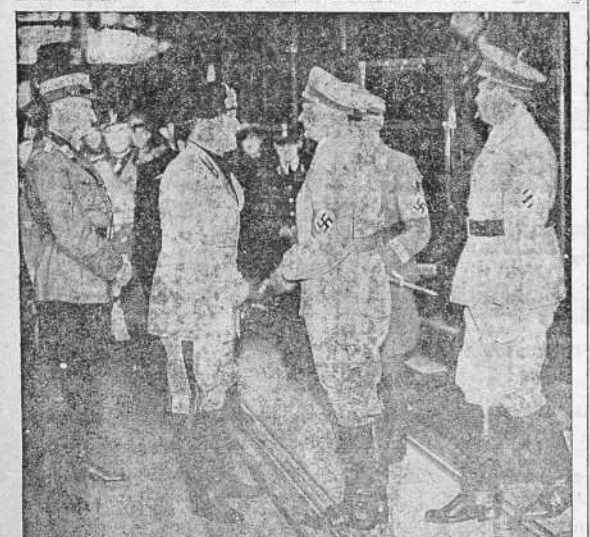
ROMA.—S. E. el conde Ciano en el momento de recibir en la estación de Roma a los representantes que Alemania ha enviado con motivo del XV aniversario de la Marcha sobre Roma

S. M. el Rey llegará a Florencia en automóvil procedente de S. Rossore. Las dos ceremonias tendrán efecto durante la mañana del propio día.