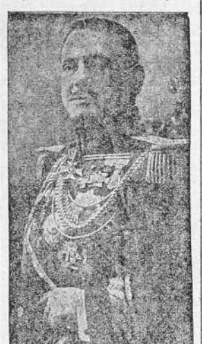
GENERAL MARTINEZ ANIDO

SALAMANCA 2.—En igual fecha, S. E. el Jefe del Estado y Ge-