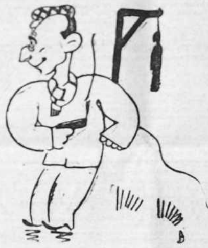
oscuridad. Hay una gran claridad en la calle de Alcalá, sobre los mármoles nuevos del Banco de España...