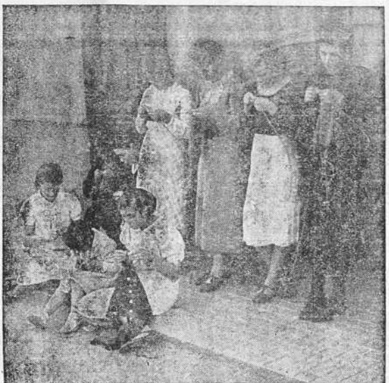
LA MAS DULCE DISTRACCION Ninguna edad es extraña al afán de esta hora. La misma infancia conoce que el más dulce juego es el que hará surgir de sus menudos dedos una prenda útil, el remedio de una necesidad para el que defienda su bienestar de mañana. La más amable distracción para todas las edades, en esta hora, es la de hacer algo grato para nuestros soldados