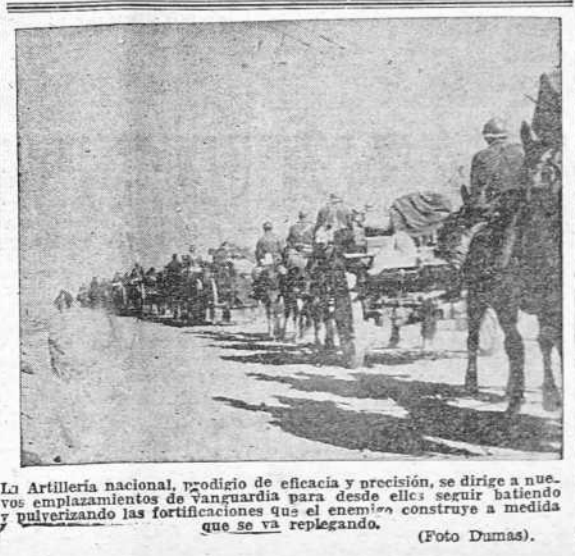
La Artillería nacional, prodigio de eficacia y precisión, se dirige a nuevos emplazamientos de vanguardia para desde ellos seguir batiendo y pulverizando las fortificaciones que el enemigo construye a medida que se va replegando.

Han avanzado—digo—nuestros chicos hasta donde convenía al plan de los Mandos, en el día de hoy. Los contrataques rojos de la noche última carecieron ya en absoluto de vigor; se ve que están convencidos del mal paso que dieron y de lo angustioso que les va resultando el desandar lo poco que anduvieron con su sorpresa del primer día. Tan es cierto lo que digo, que ya han empezado a huir por el sector, como aconteció por el de Levante. Las deserciones en masa de los marxistas a nuestro campo, junto con sus jefes y jefecillos extranjeros, que, por cierto, van siempre delante cuando se acercan a nuestras trincheras, con las manos bien en alto y proclamando que están hartos de luchar sin fruto,