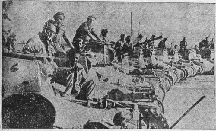
Carros de asalto y aviones nacionales. Si los primeros arrollan al enemigo, los segundos lo machacan. Cuántas páginas de heroísmo han escrito en esta guerra de liberación estas Armas del Ejército de España! El grabado recoge precisamente el momento en que los tanques se disponen a entrar en acción y los "cazas" van a dar comienzo a las arriesgadas "cadenas".