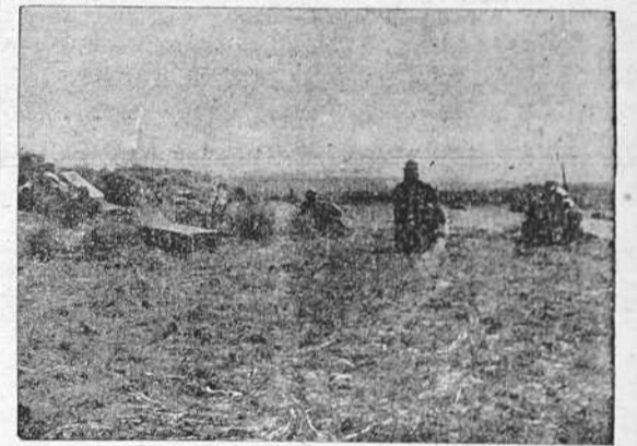
Los gloriosos infantes españoles avanzan siempre, persiguiendo y derrotando a la horda roja. Así van rescatando palmo a palmo el territorio patrio. (Foto Dumas).

Salamanca, 3 de agosto 1938. III Año Triunfal. De orden de S. E., el general jefe de Estado Mayor, FRANCISCO MARTIN MORENO.