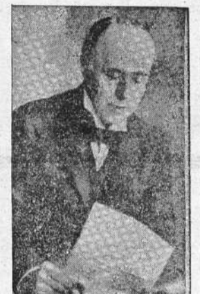
Lord Runciman, que el Gobierno inglés envió a Praga para mediar en las negociaciones entre el Gobierno checo y los alemanes de los sudetes.

El mediador británico ignora el tiempo que permanecerá en la capital checa