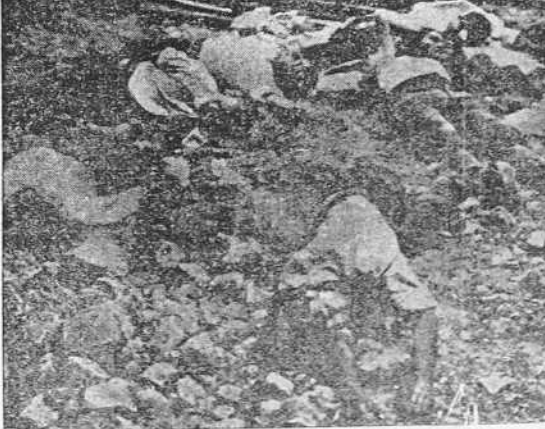
He aquí una escena familiar a los infelices habitantes de la zona roja. Los asesinatos de gentes que no han cometido ningún delito, y que pagan con la muerte la "culpa" de ser buenos españoles y de no haber aprendido a blasfemar de su Dios y de su Patria. La fotografía está tomada en Barcelona y es una de tantas de las que han aparecido publicadas en periódicos y revistas nacionales y extranjeras.