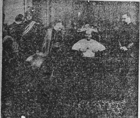
En el último retrato de S. S. Pío XI, pudo captarse hace pocos días en su residencia veraniega de Castelgandolfo, durante una audiencia concedida por el Sumo Pontífice a los miembros de la Acción Médica italiana.

Avenida de Rubia, 10, 1.º Dirección y Redacción 1177. Administración 1543